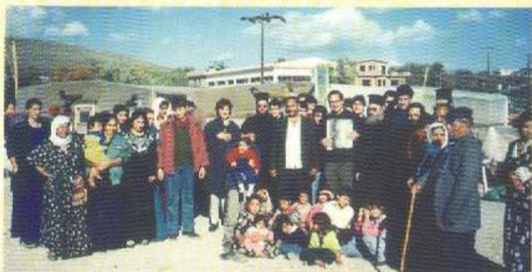
Ἐπίσκεψη Καθηγητῶν καί Μαθητῶν σέ καταυλισμό ἀθιγγάνων.

ὑποψήφιοι Κληρικοί. Μέ ἄλλα λόγια δέν εἶναι ὑποχρεωμένοι ὅσοι φοιτοῦν νά γίνουν ἱερεῖς. Ἄλλωστε κατά τή διάρκεια τῆς λειτουργίας του ἐκτός ἀπό τούς μαθητές πού πέτυχαν τήν εἰσαγωγή τους σέ Θεολογικές σχολές, ἄρκετοί ἄλλοι εἰσήχθησαν σέ Σχολές τῆς ἐπιλογῆς τους.