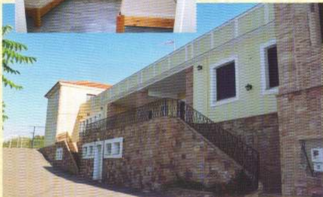
Βόρεια ἄποψη τοῦ Λυκείου.