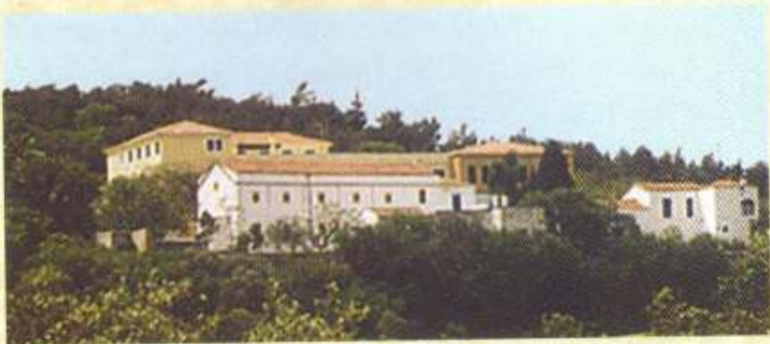
Ἐπιθεώρηση τοῦ Σχολικοῦ Συγκροτήματος τοῦ Λυκείου καί τῆς Ἱερᾶς Μονῆς Ἁγ. Ἀναργύρων Θυμαίων.

μέ τό Προεδρικό Διάταγμα 75/ 5-4-96. Ἰδρύθηκε μέ σκοπό νά καλύψει τίς ἀνάγκες τῆς Ἐκκλησιαστικῆς Ἐκπαίδευσης τῶν Νησιῶν τοῦ Βορείου Αἰγαίου (Χίου, Λέσβου, Σάμου, Λήμνου, Ἰκαρίας) ἀλλά καί νά στηρίξει τήν ἐκπαίδευση μαθητῶν ἀπό κάθε τόπο τῆς Πατρίδας μας, πού δέν τούς βοηθοῦν οἱ οἰκονομικές τους δυνατότητες νά φοιτήσουν σέ κάποιο ἄλλο Ἐνιαῖο Λύκειο.