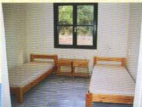
Κοιτάνας τοῦ Οἰκοτροφείου τοῦ Λυκείου.

Ἡ διαμονή τους εἶναι σέ δίκλινα δωμάτια, τά ὁποῖα διαθέτουν τό καθένα ξεχωριστό χῶρο ὑγιεινῆς. Ἡ ἴδια δυνατότητα παρέχεται καί σέ ὅσους μαθητές ἀπό τή Χίο τό ἐπιθυμοῦν. Ὅσον ἀφορᾷ στόν περιβάλλοντα χῶρο πρέπει νά ποῦμε ὅτι εἶναι κάτι τό ξεχωριστό, διότι τό δι- δακτήριο εἶναι κτισμένο στούς πρόποδες τοῦ λόφου τοῦ