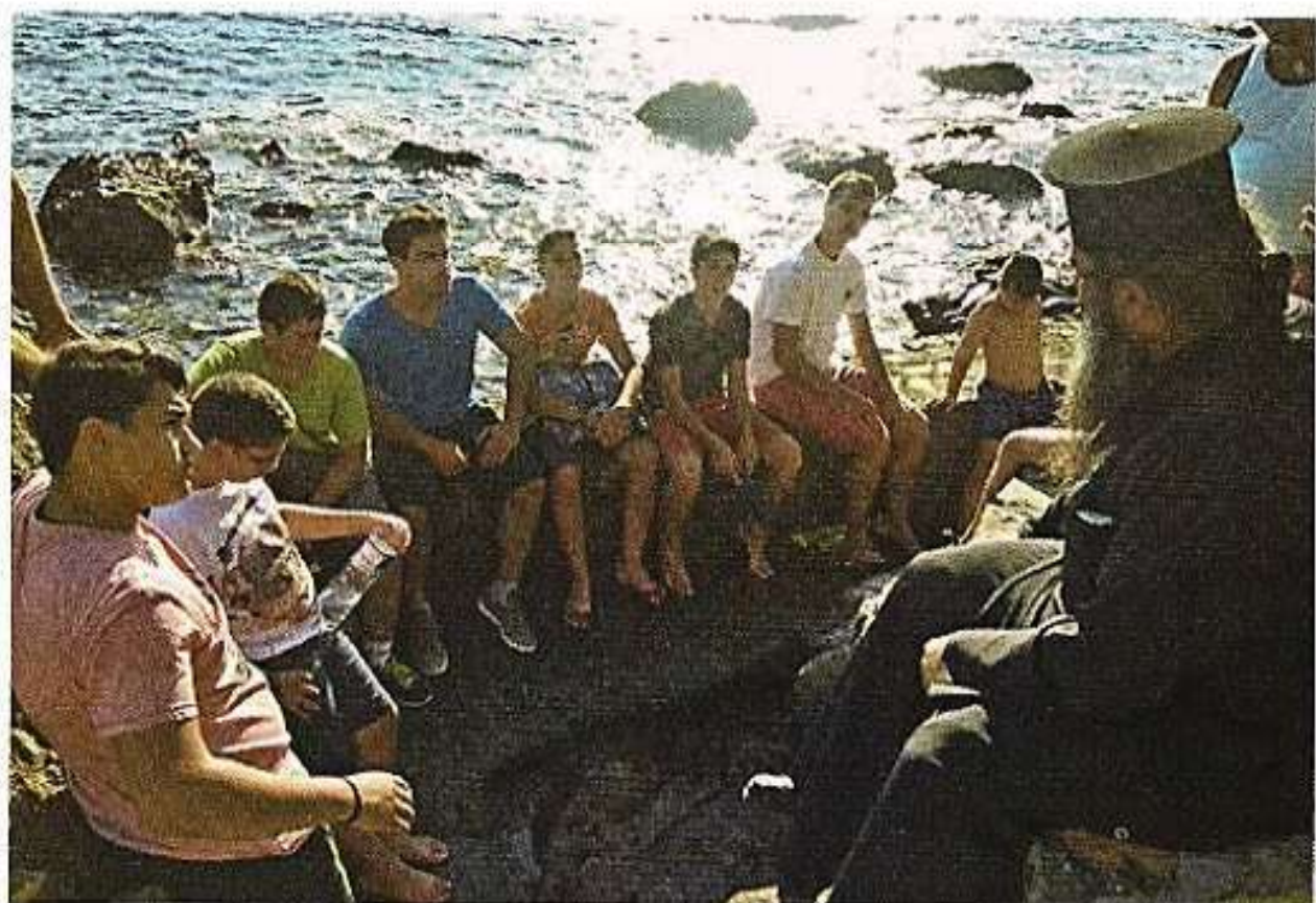
Στιγμές από την Κατασκήνωση της Ίερας Μητροπόλεως Χίου.