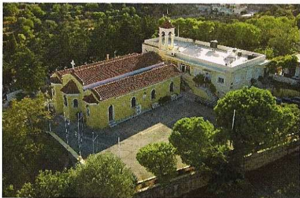
Τ. Ναός Παναγίας Τρουλλοτής πόλεως Χίου.