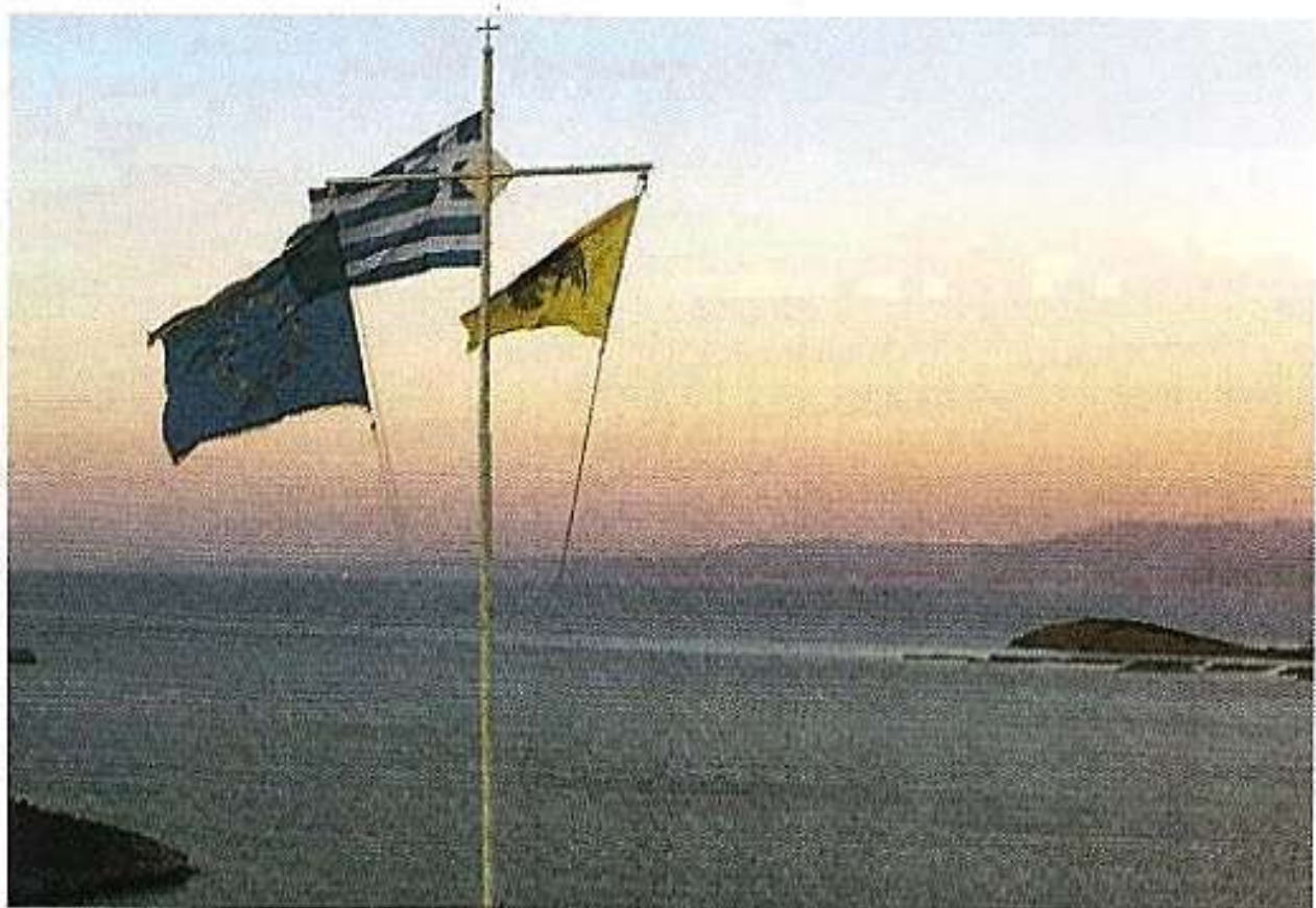
Νῆσος Παναγιά: Τά ἀνατολικά σύνορα τῆς Ἑλλάδος καί τῆς Εὐρωπαϊκῆς Ἑνώσεως.