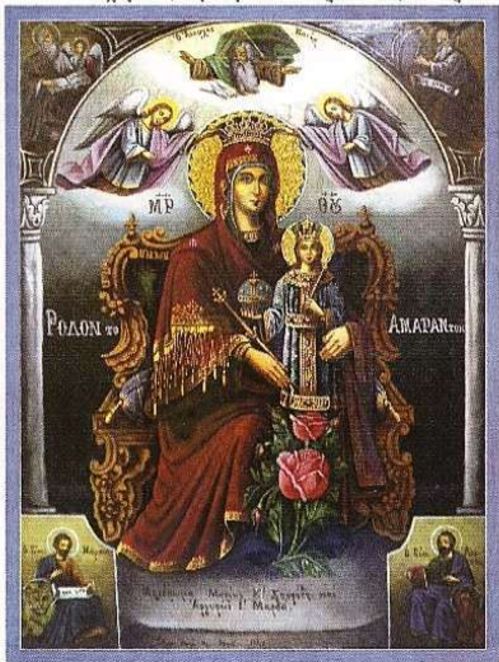
Ἰ. Εἰκὼν «Ρόδον τὸ Ἀμάραντον», Ἰ. Νανὴ Κοιμησεως Θεοτόκου Θεολογοποταμίου.

«Τούτο δὲ καὶ εὐχόμεθα, τὴν ὑμῶν καταρτίσιν» (Β' Κορινθ. ιγ', 9)