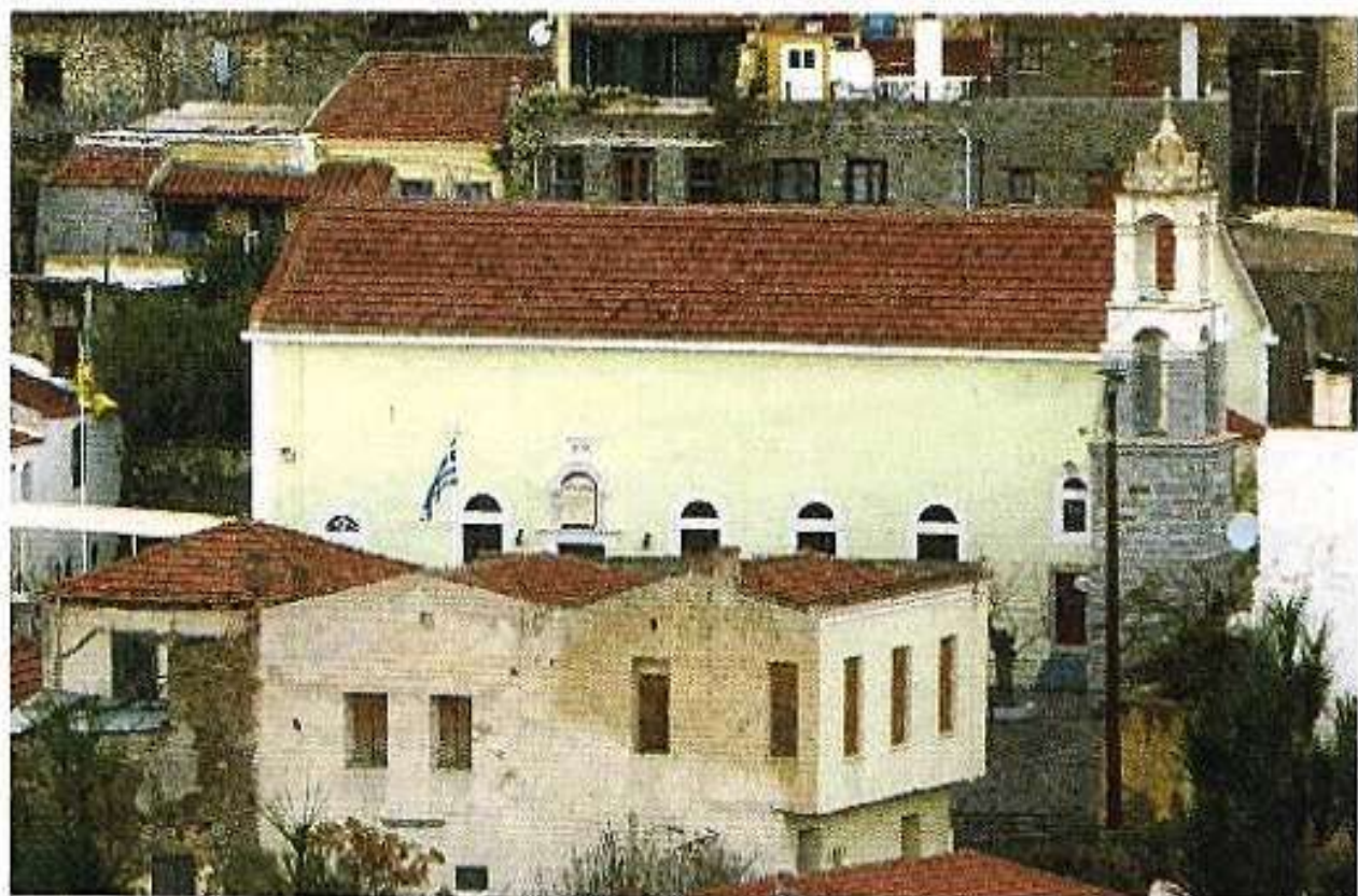
Ἱ. Ναός Κοιμήσεως Θεοτόκου Βουλισσοῦ.