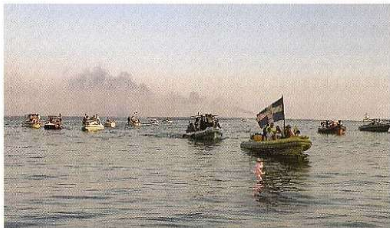
Διὰ θαλάσσης ἀφιξεις Ἱ. Εἰκόνας Ἀγ. Αἰμιλιανοῦ εἰς Καλλιμασιάν (7/8/2017).