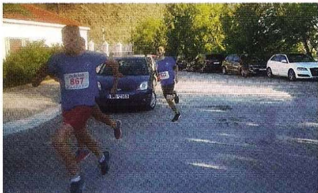
«Τρέχουμεν τόν προκείμενον ἡμῖν ἀγῶνα, ἀφορῶντες εἰς τόν τῆς πίστεως ἀρχηγόν καί τελειωτήν Ἰησοῦν» (Εβρ. 12, 1-2) «Λόγιος Πίστεως» πρὸς τιμὴν τῆς Χριστολογίτιδος Ἀγ. Μαρκέλλης (30/7/2017).