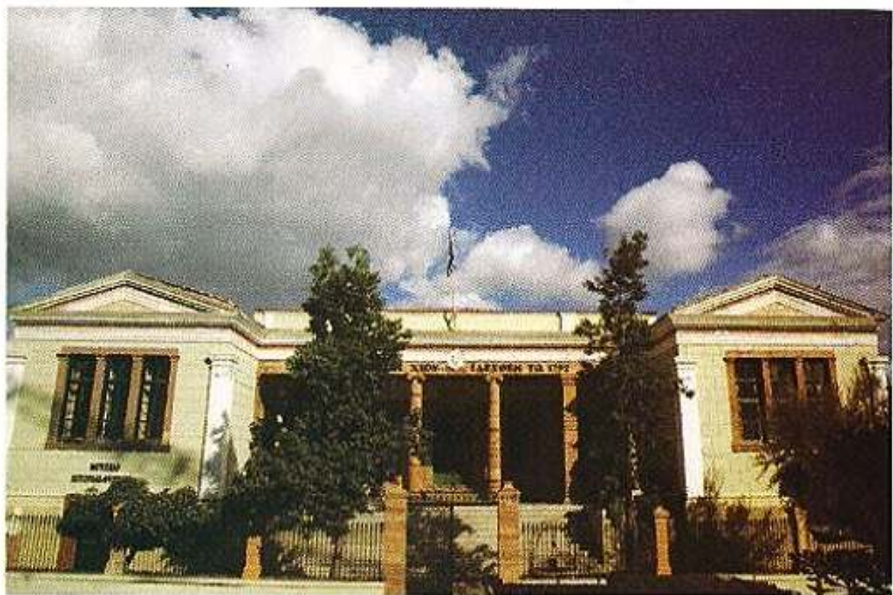
Τό Γυμνάσιον Χίου ἰδρυθέν τό 1792.