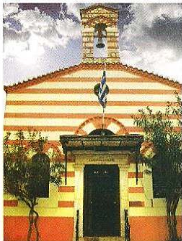
Ἐξῆς Ναός Ἁγίων Ἀποστόλων Κυψέλης (Ναός Κωνσταντίνου Κανάρη).