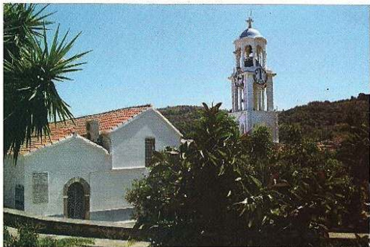
Ἱερός Ναός Ὑπαπαντῆς τοῦ Κυρίου Καρδαμύλων Χίου.