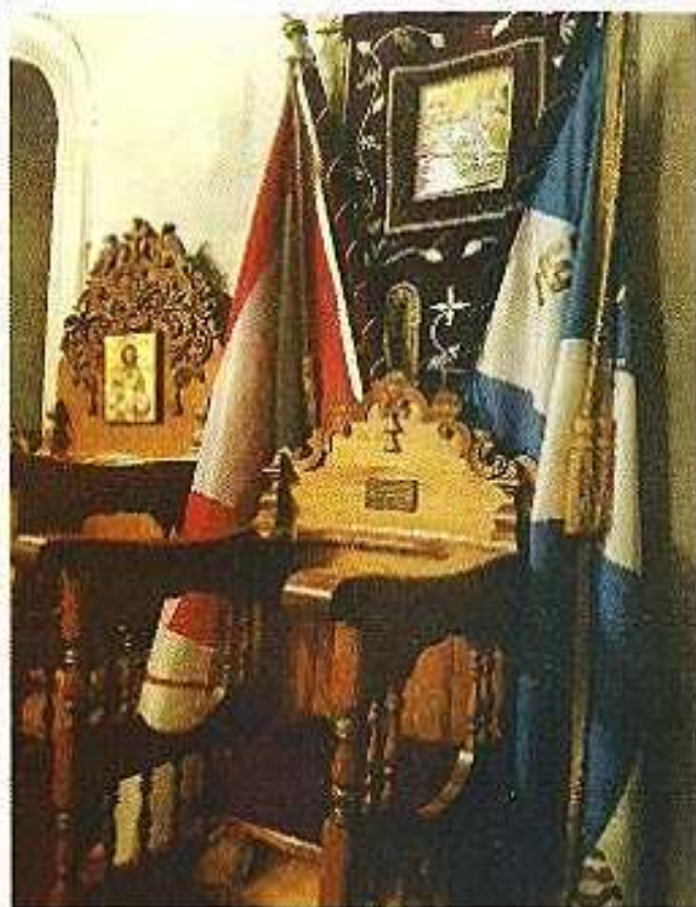
Τό στασίδιον τοῦ περπολιχοῦ Κωνσταντίνου Κανάρη εἰς τόν Ἱ. Ναόν Ἁγίων Ἀποστόλων Κυψέλης.