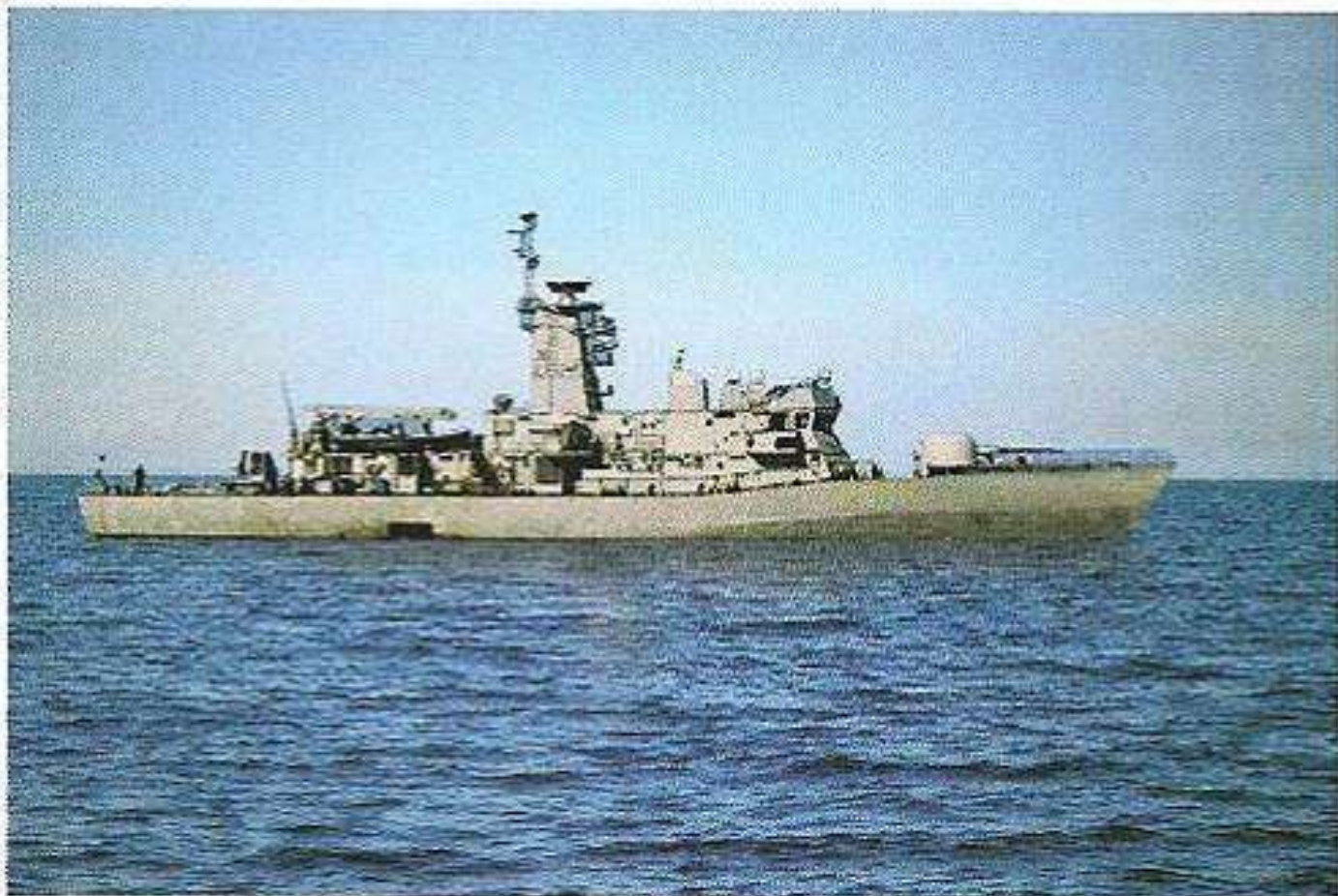
Ἡ κανονιοφόρος τοῦ Ἑλληνικοῦ Πολεμικοῦ Ναυτικοῦ «ΚΡΑΤΑΙΟΣ» πρὸς τὴν νῆσον ΠΑΝΑΓΙΑ.