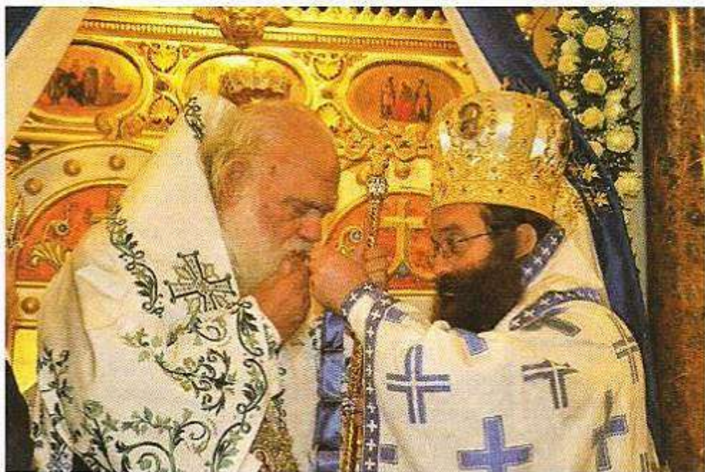
Εἰς τόν Μακαριώτατον Ἀρχιεπίσκοπον Ἀθηνῶν καὶ πάσης Ἑλλάδος κ.κ. Ἱερώνυμον. (Μνήμη Ἁγίων Βικτόρων & Ἐλευθέρια Χίου 2013.)