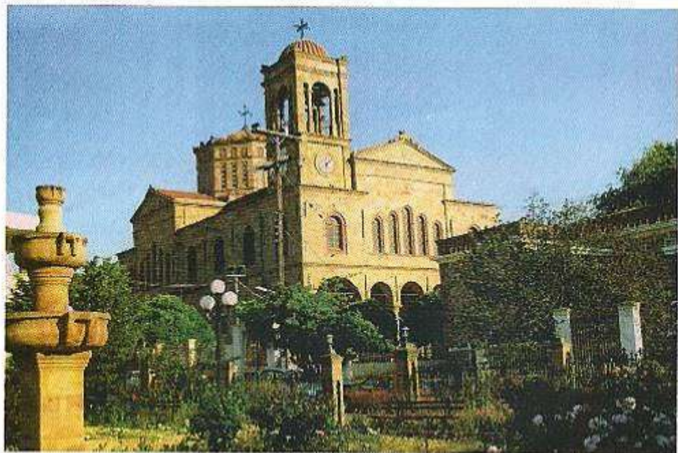
Ἱ. Ναός Ἁγίου Εὐστρατίου Θυμιανῶν Χίου.