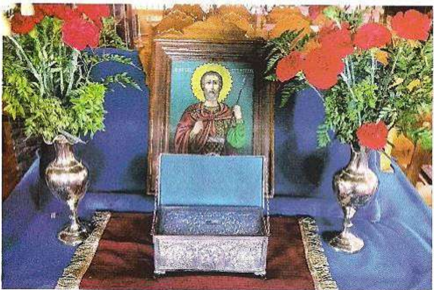
Ἱ. Λείψανον Ἀγ. Εὐστρατίου εἰς τόν Ἱ.Ν. Ἀγ. Εὐστρατίου Θυμιανῶν, προσφερθέν ὑπό τοῦ Χίου Μητροπολίτου Φιλίππου, Νεαπόλεως καί Θάσου κ. Προκοπίου (2011).