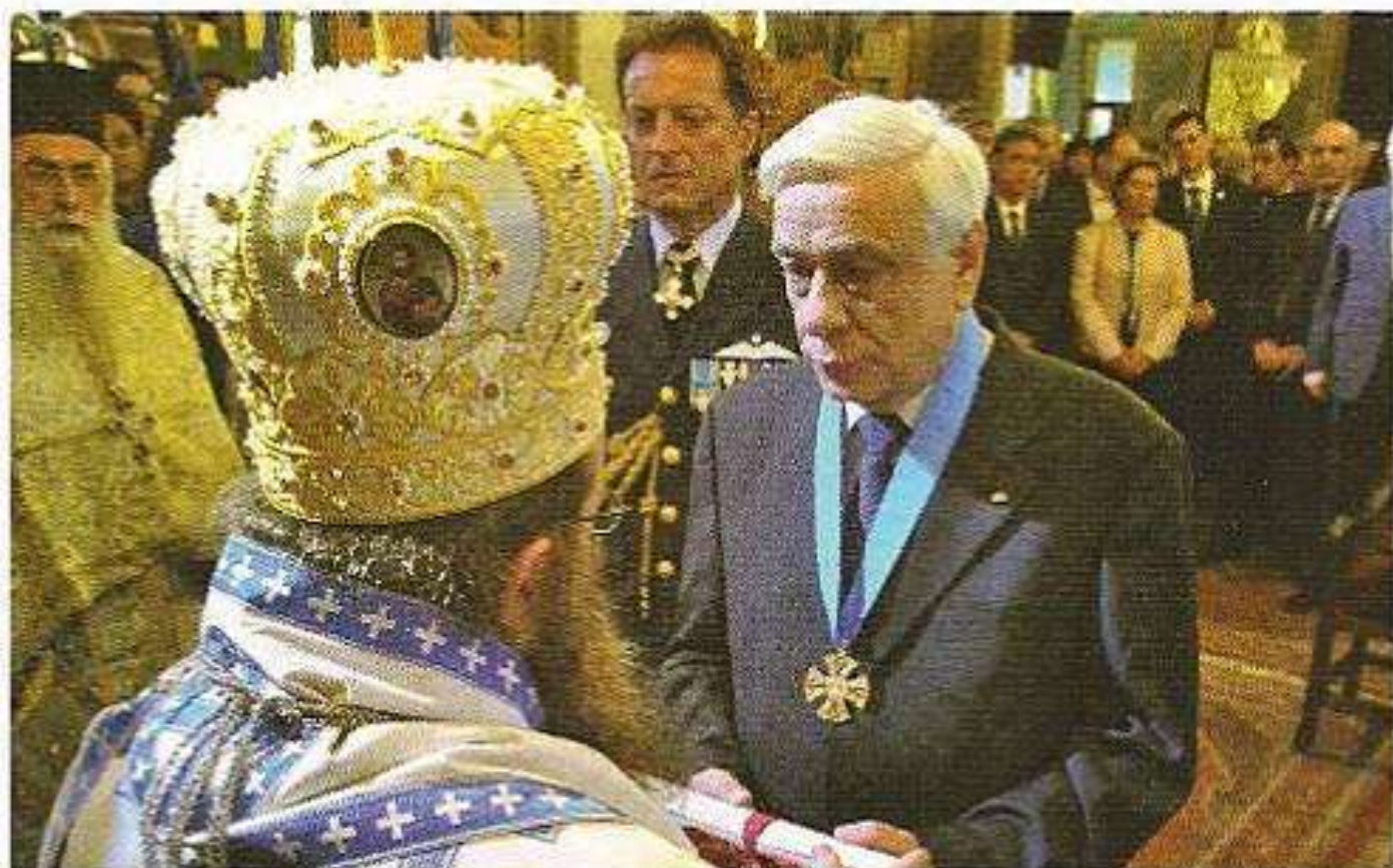
Εἰς τόν Ἐξοχώτατον Πρόεδρον τῆς Ἑλληνικῆς Δημοκρατίας κ. Προκόπιον Παυλόπουλον. (Ἐλευθέρια Χίου 2015.)