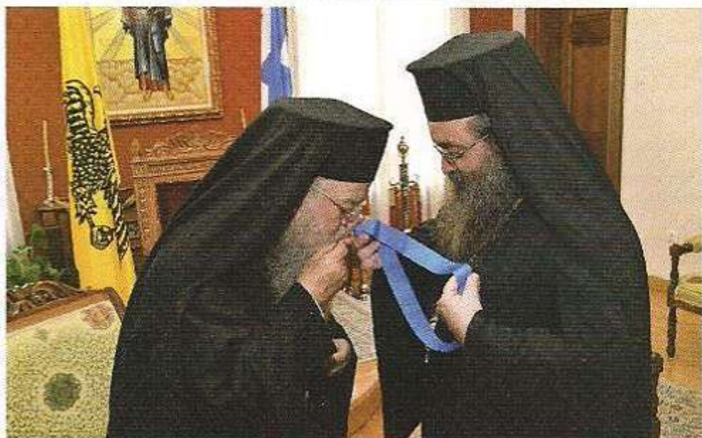
Εἰς τόν Παναγιώτατον Μητροπολίτην Θεσσαλονίκης κ. Ἀνθίμου. (Μνήμη Ἁγίου Εὐσταθίου Ἀρχιεπισκόπου Θεσσαλονίκης 2016.)