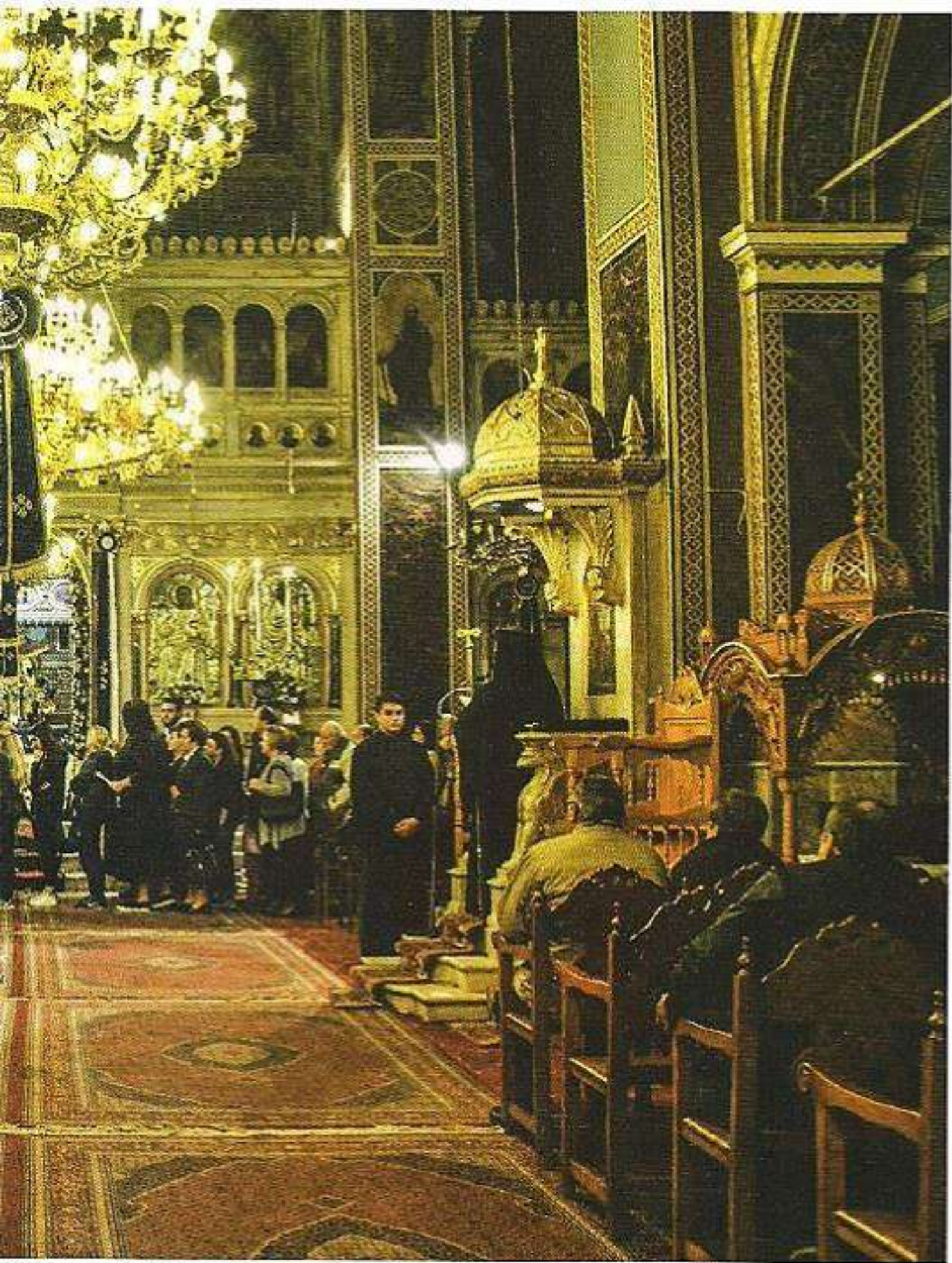
Εύρησιν της Ἁ. Εἰκόνης Παναγίας Σοτηρῆ Χίου (10 - 13 Νοεμβρίου 2016).