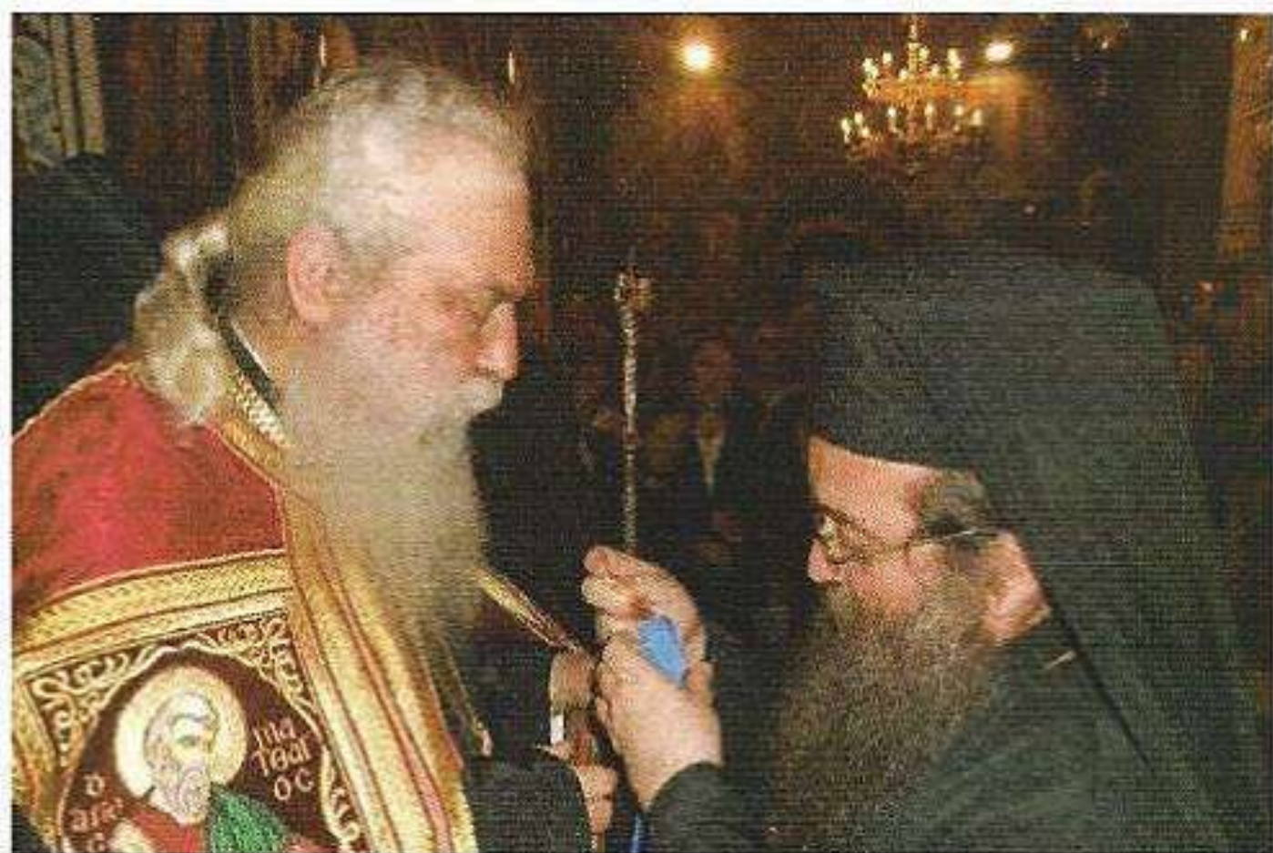
Εἰς τόν Σεβασμιώτατον Μητροπολίτην Μονεμβασίας καί Σπάρτης κ. Εὐστάθιον. (Μνήμη Ἁγίας Μαρκέλλης Χιοπολίτιδος 2016.)