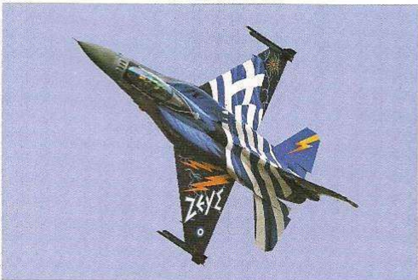
Τὸ ἀεροσκάφος τῆς Πολεμικῆς Ἀεροπορίας «ΖΕΥΣ» ἀποδίδει τιμὲς κατὰ τὴν 104ην ἐπέτειον τῆς ἀπελευθερώσεως τῆς Χίου ἀπὸ τὸν Ἰουρκοὺν ζυγὸν (11.11.2016).