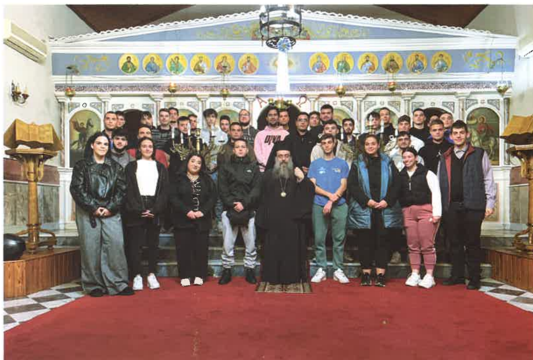
Συνάντησις με φοιτητάς και σπουδαστάς (29.10.24).