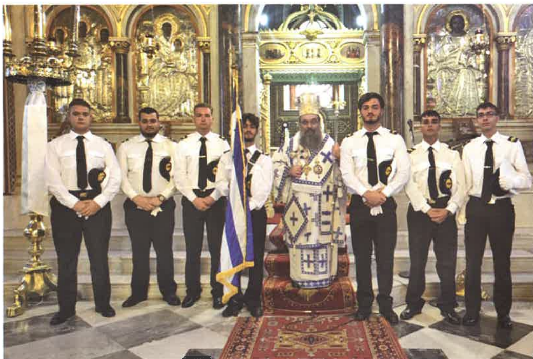
Χριστός, Έλλάς και Θάλασσα. (Ο Σεβ. Χίου με σπουδαστές της ΑΕΝ Μηχανικών και την Έλληνικήν Σημαία) (28.10.24).