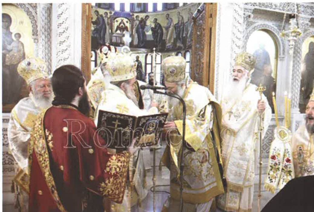
Ὁ Σεβ. Χίου κ. Μάρκος ἐπιδίδει τὴν ποιμαντορικὴν ράβδον εἰς τὸν Θεοφ. Ἀχελώου κ. Νήφωνα (05.10.24).