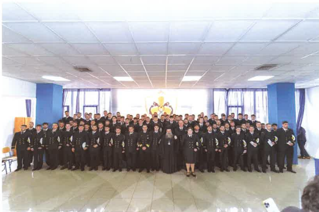
Υποδοχή Πρωτοετών ΑΕΝ Μηχανικών Χίου. (19.11.2024)