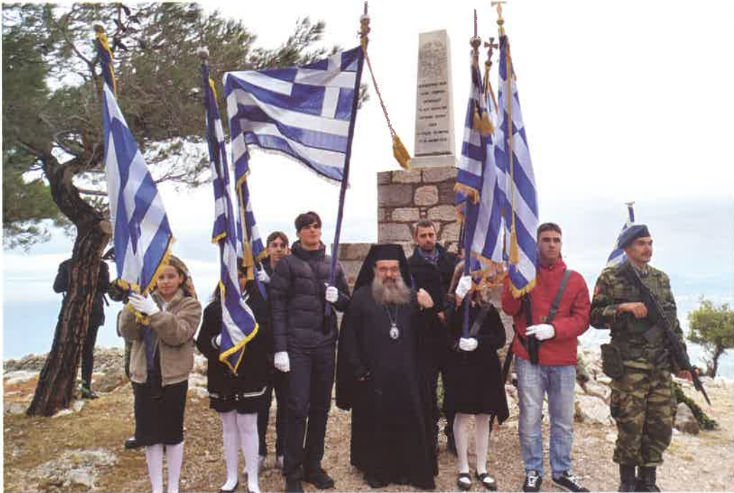
Τὸ ἡρωϊκὸν ὄρος Αἶπος στεφαναμένον ἀπὸ τῆς Σημαῆς τῶν Σχολείων τοῦ Βροντάδου. (17.11.2024)