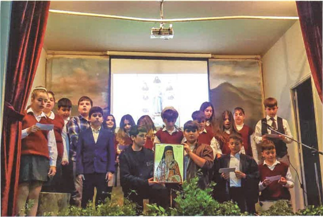
Έορτή τοῦ Ἁγ. Νεκταρίου ἀπὸ τὸ Δημοτικὸν Σχολεῖον Κάμπου. (09.11.2024)