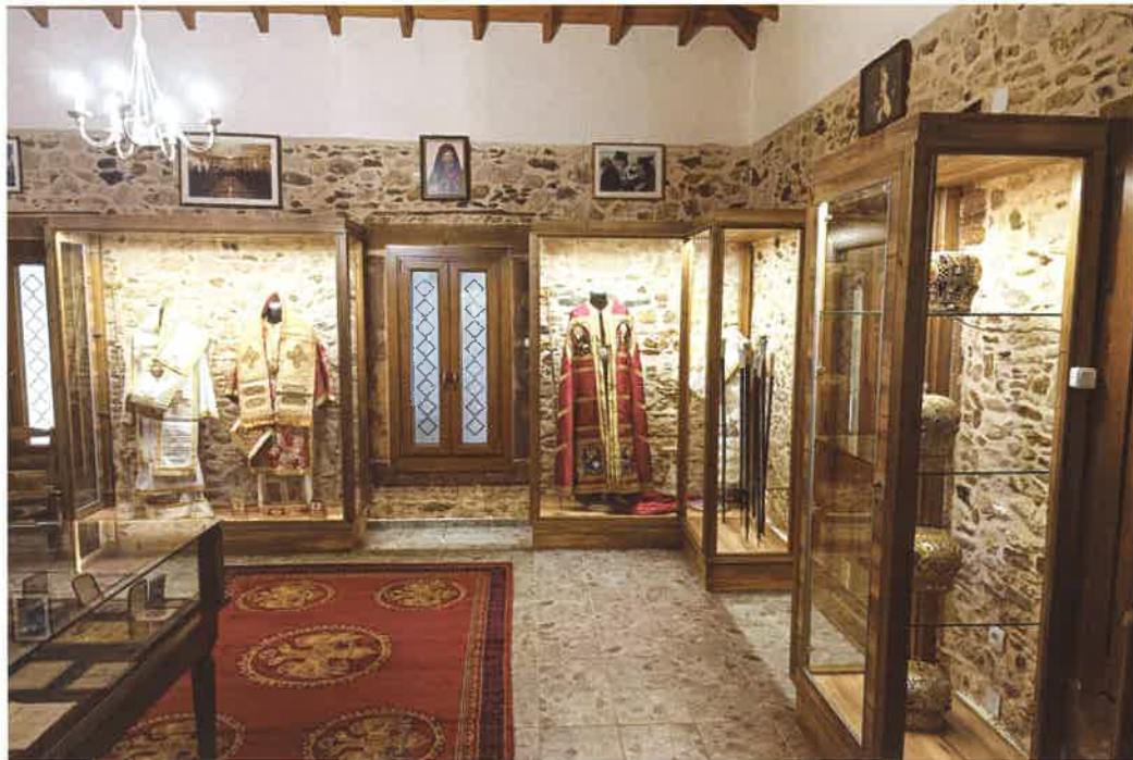
Κειμηλιαρχείον «Μητροπολίτου Χίου, Ψαρών και Οίνουσσών ΔΙΟΝΥΣΙΟΥ».