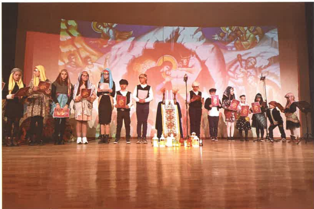
Χριστουγεννιάτικη Έορτή Κατηχητικών Σχολείων. (22.12.2024)