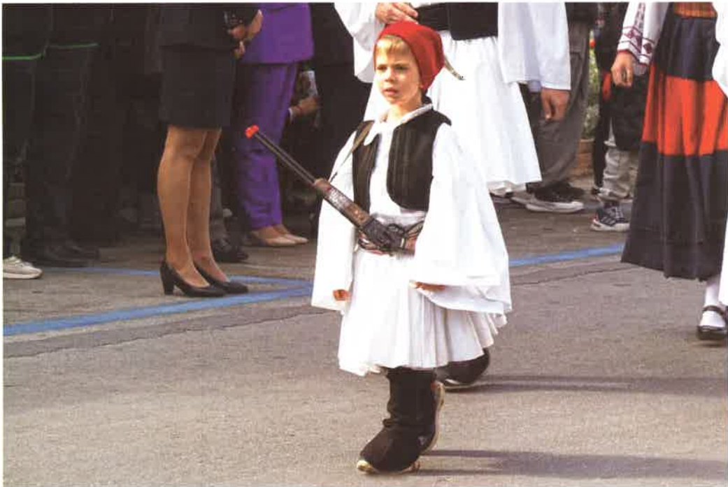
«Άμες δέ γ' ἐσσόμεθα πολλῶ κάρρονες». (11.11.2024)