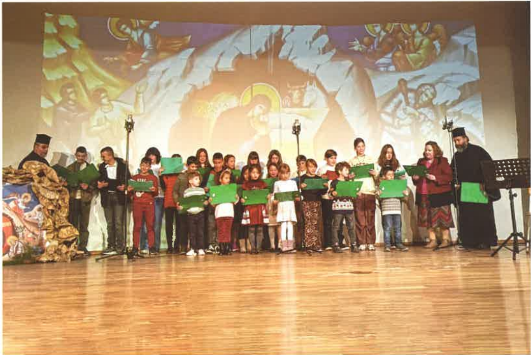
Χριστουγεννιάτικη Έορτή Κατηχητικών Σχολείων. (22.12.2024)