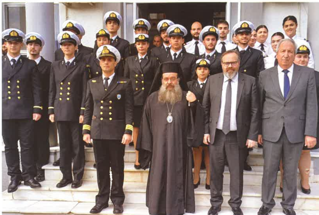
Υποδοχή Πρωτοετών ΑΕΝ Πλοιάρχων Οίνουσσών. (18.11.2024)