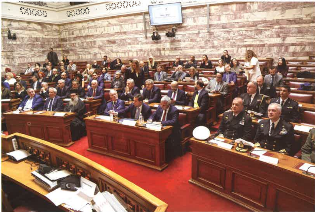
Ἐκδήλωση τῆς Βουλῆς τῶν Ἑλλήνων διά τό ὀλοκαύτωμα τῶν Ψαρῶν καί τόν Κ. Κανάρη. (Αἴθουσα Γερουσίας 13.11.2024)