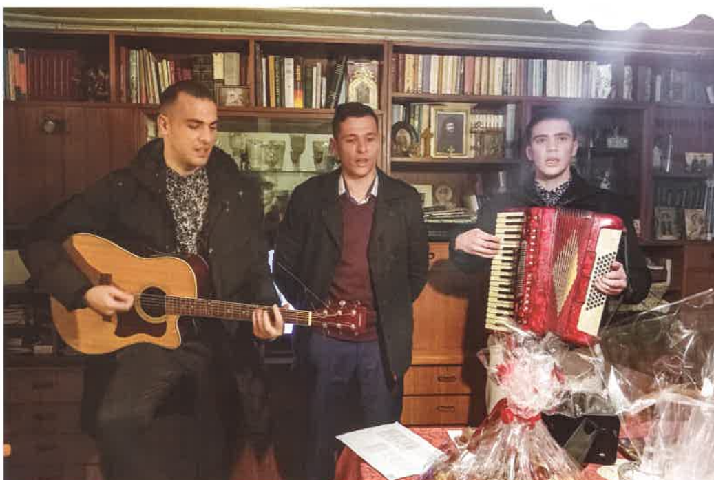
Στελέχη τῆς Κατασκηνώσεως τῆς Ἱ. Μ. Χίου ΤΟ ΚΑΡΑΒΙ ΤΟΥ ΧΡΙΣΤΟΥ ψάλλουν τὰ Κάλαντα εἰς τὴν οἰκίαν τοῦ Σεβασμιωτάτου. (31.12.2024)