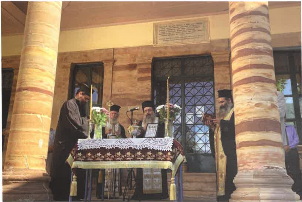
Άγιασμός ένάρξεως μαθημάτων (Α' Γυμνάσιον Χίου 11.09.25)