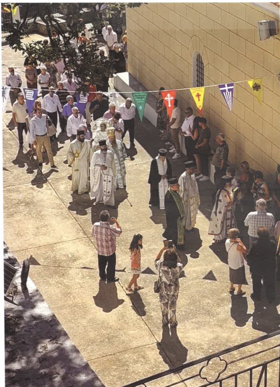
Ἑλληνικά χωριά, οἱ πνεύμονες τοῦ τόπου μας (Ι. Ν. Ἁγ. Μάμαντος Ἀφροδισίων 02.09.25)