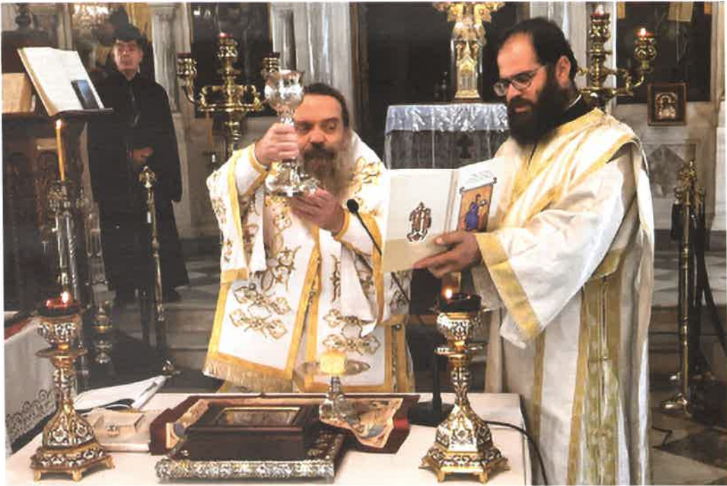
Θ. Λειτουργία Ἁγ. Μάρκου εἰς Ἱ.Ν. τοῦ ἁγίου εἰς Βροντάδον (28.09.25)