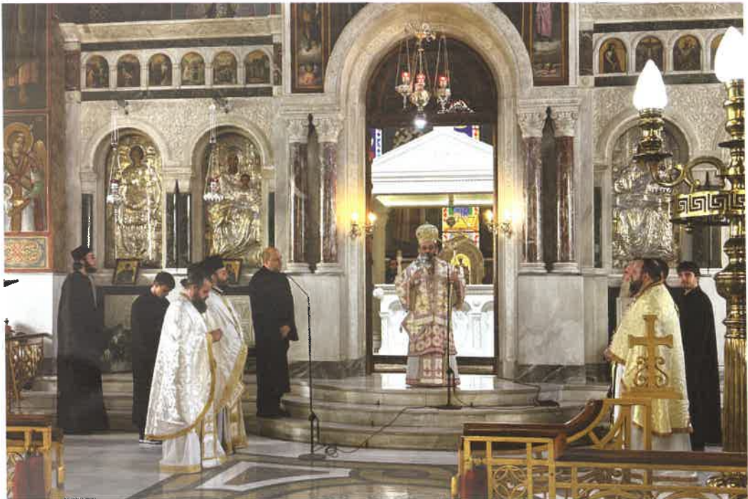
Θ. Λειτουργία τῶν ἐν Χίῳ Ἁγίων εἰς Ἱ.Ν. Ἁγ. Δημητρίου Ν. Φαλήρου (12.10.25)