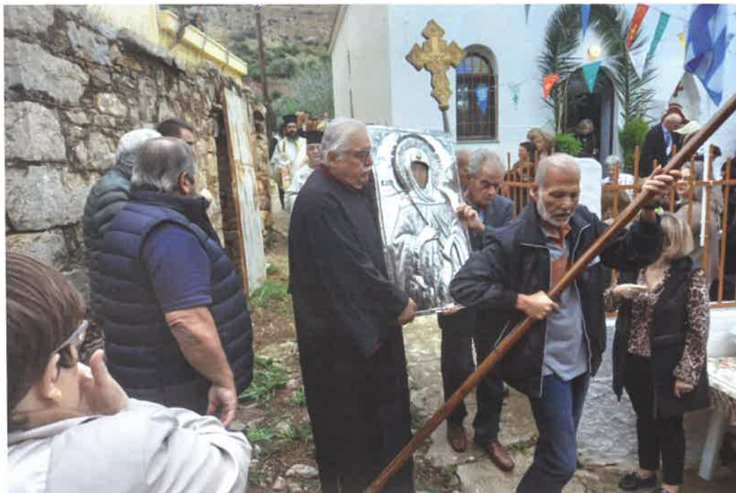
Γ. Ν. Αγ. Ματρώνης Καταβάσεως (20.10.25)