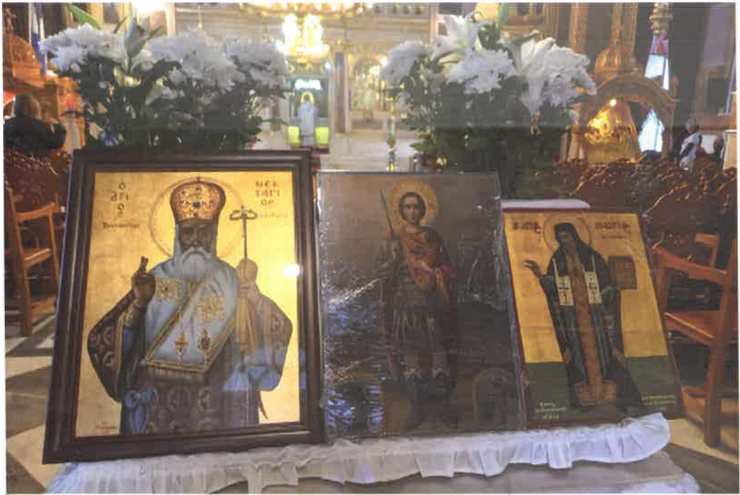
Προστάται ἅγιοι τῶν ἀθλητῶν (Ἄγ. Νέστωρ, Ἄγ. Νεκτάριος, Ἄγ. Μακάριος) (Ι.Μ.Ν. Χίου 05.10.25)