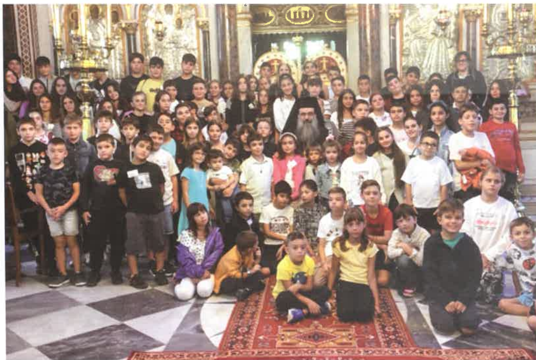
Έναρξις Κατηχητικῶν Σχολείων (28.09.25)