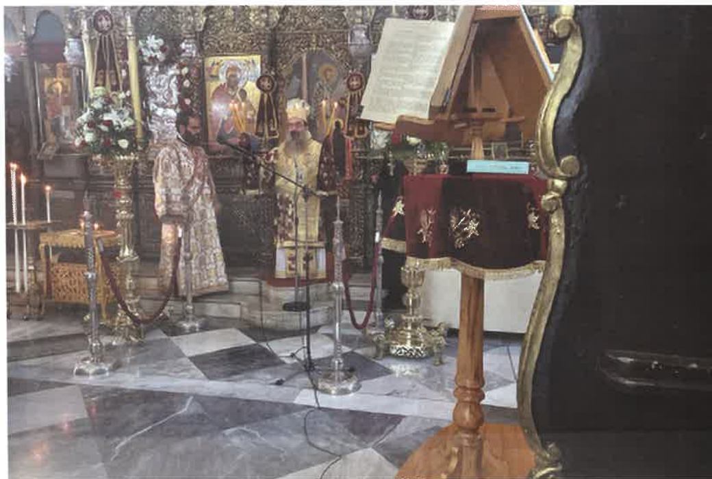
Γ. Ν. Αγ. Δημητρίου Άρμολίων (26.10.25)