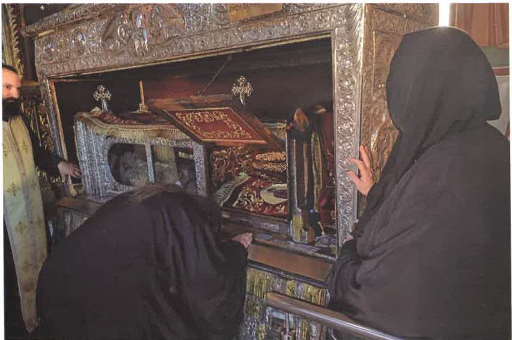
Προσκύνησις ἰ. σκηνώματος Ἄγ. Γερασίμου εἰς Κεφαλληνίαν (20.09.25)