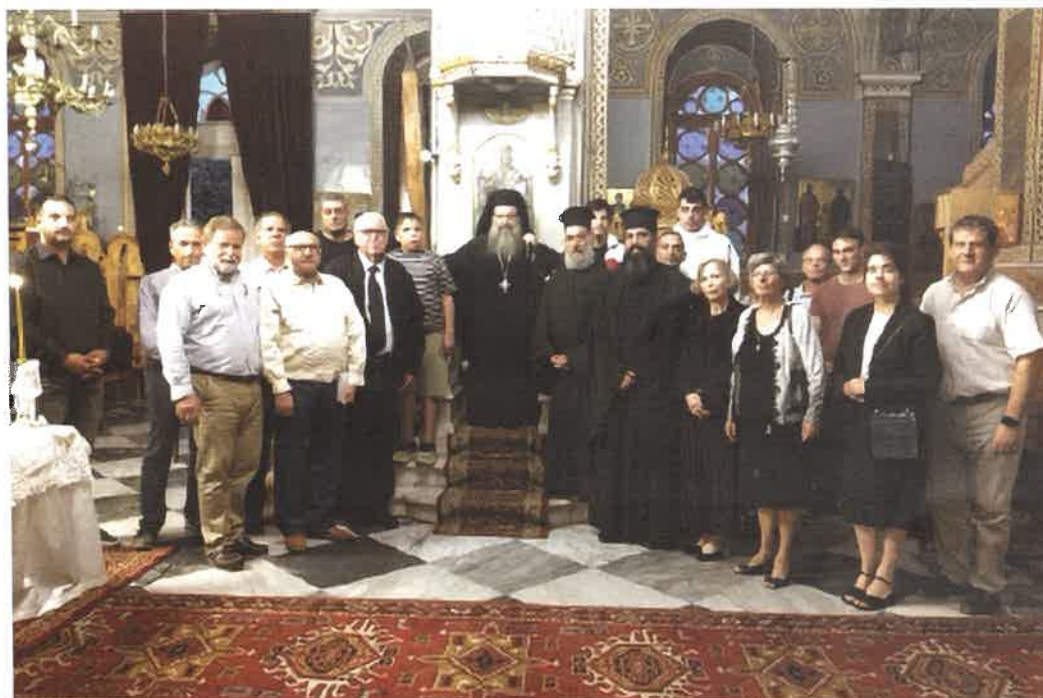
Έναρξις Σχολῆς Βυζ. Μουσικῆς (28.09.25)