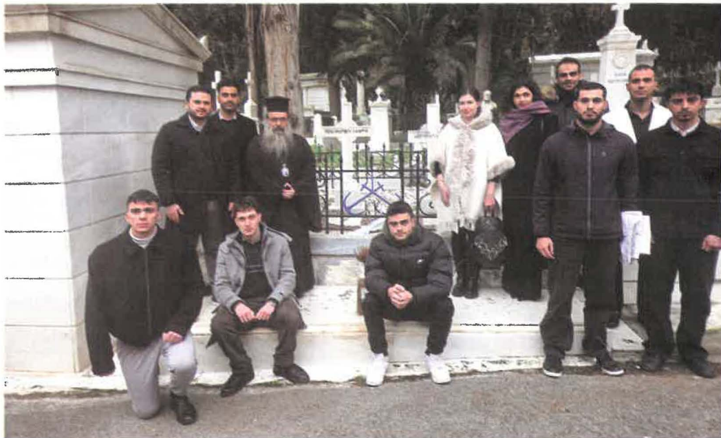
Εἰς τόν τάφον τοῦ Κανάρη