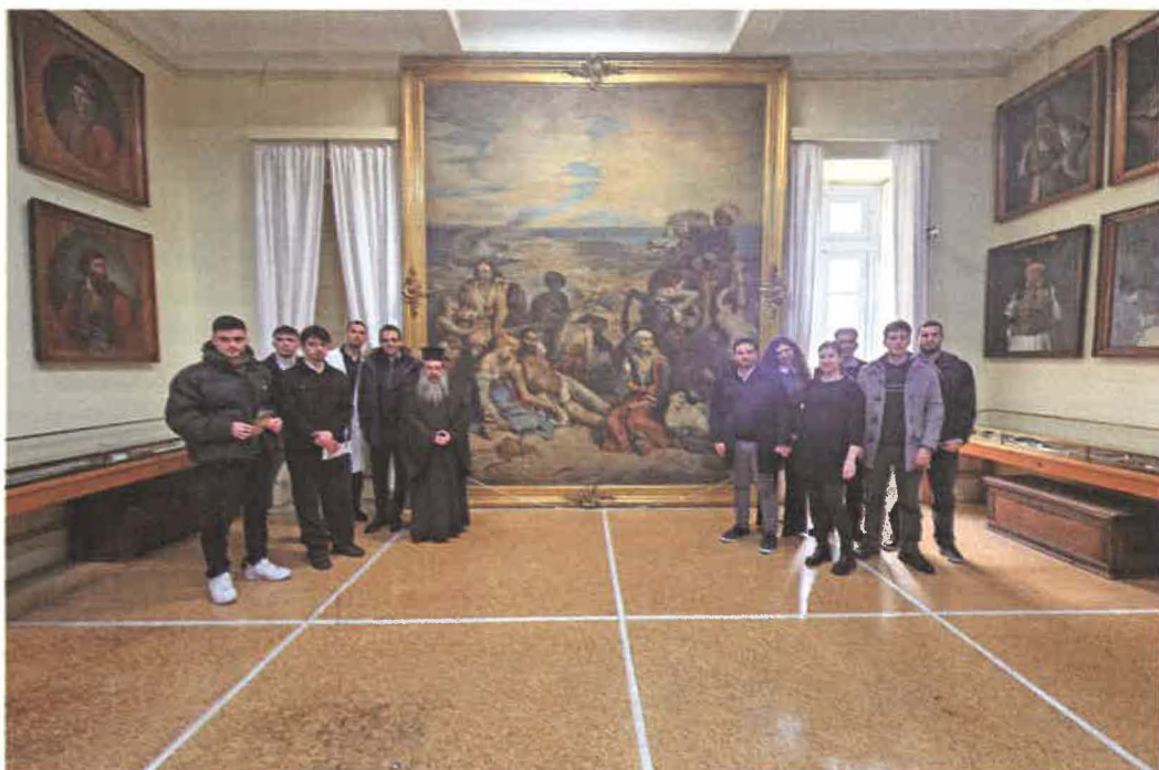
Εἰς τό Πολεμικόν Μουσεῖον