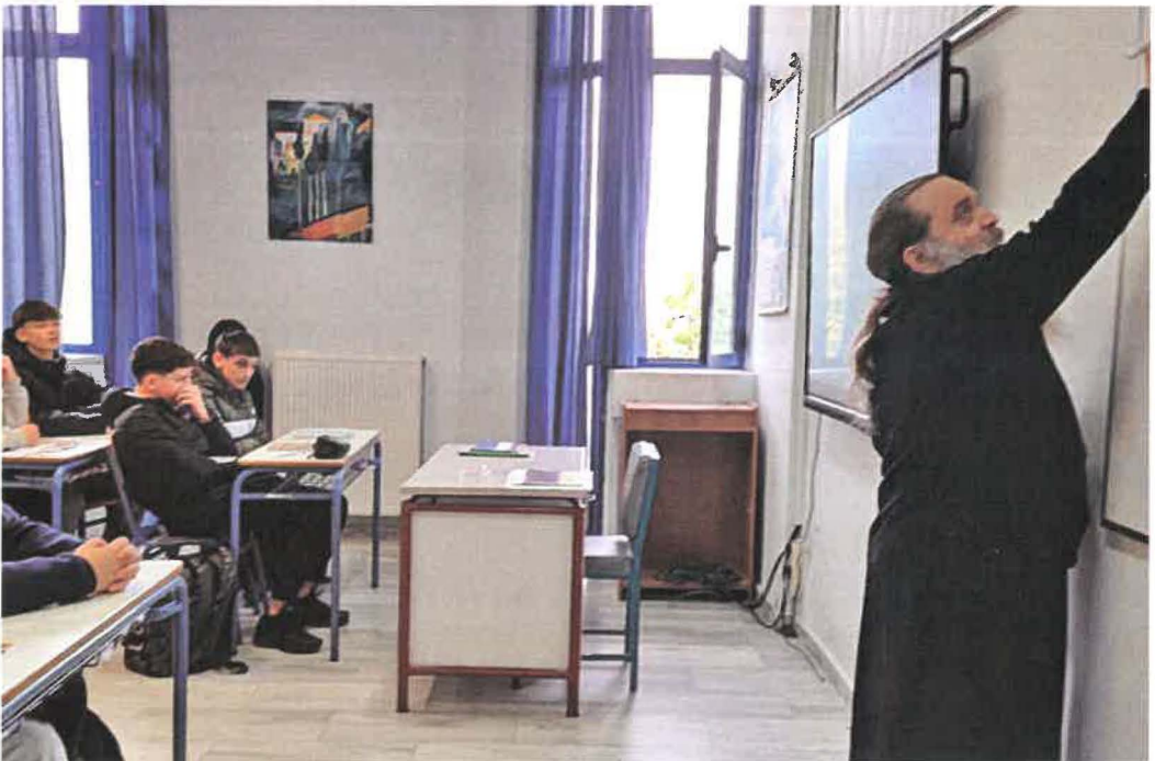
Ό Φιλολόγος Ιεράρχης διδάσκει Αρχαία Έλληνικά μαθητάς Γυμνασίου Βροντάδου (18.02.26)