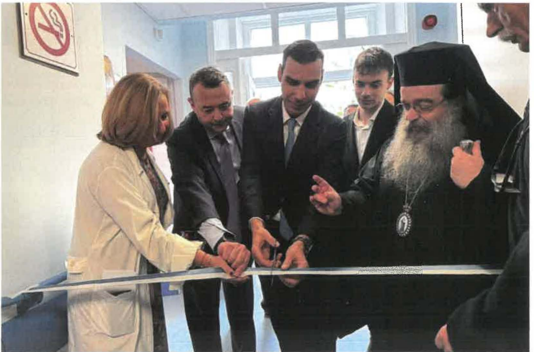
Ὁ Ὑφυπ. Ὑγείας κ. Θεμιστοκλέους ἐγκαινιάζει ἀνακαισθεῖσαν δαπάναις τῆς Ἱ.Μητροπόλεως Παιδιατρικὴν Κλινικὴν Σκυλιτσείου (29.01.26)