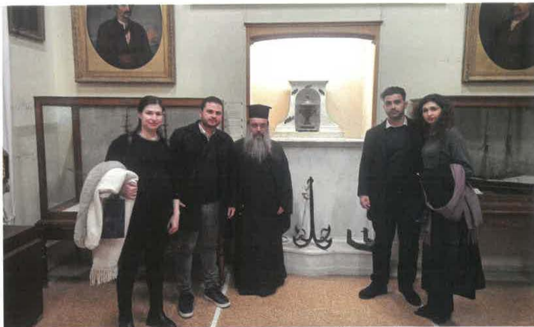
Πρό τῆς καρδιᾶς τοῦ Κανάρη