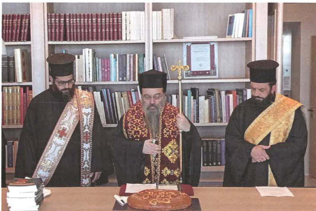
Ευλόγησις άγιοβασιλόπιτας Βιβλιοθήκης ΑΓ. ΑΓΑΠΗΤΟΣ (02.01.26)