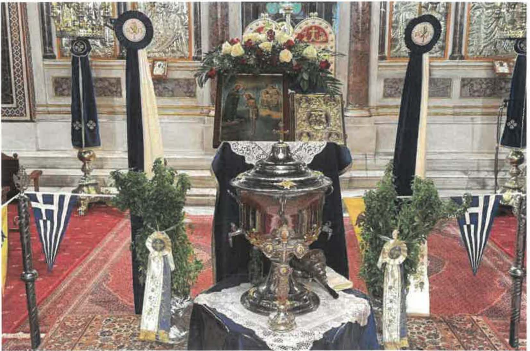
Θεοφάνεια εἰς Ἱ.Μ. Ναόν Χίου (06.01.26)