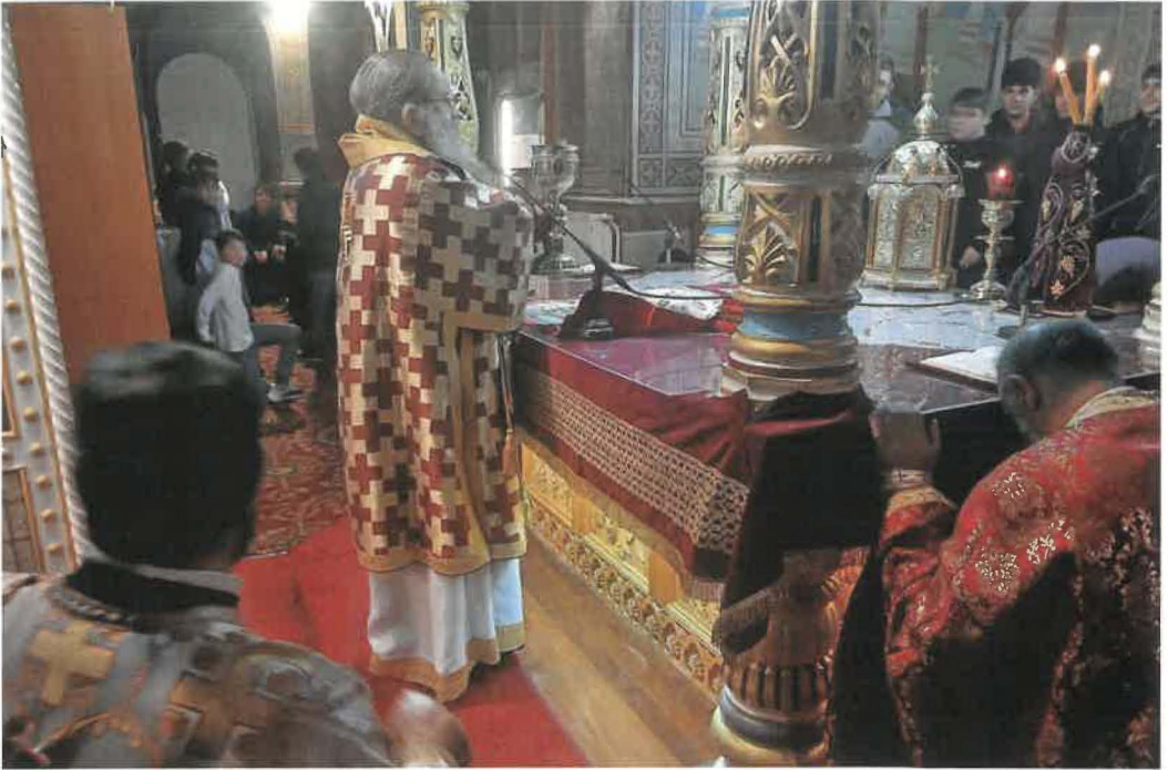
Θ. Λειτουργία Τριῶν Ἱεραρχῶν μέ τό Ἱερόν Βῆμα γεμάτον ἀπό μαθητάς (30.01.26)