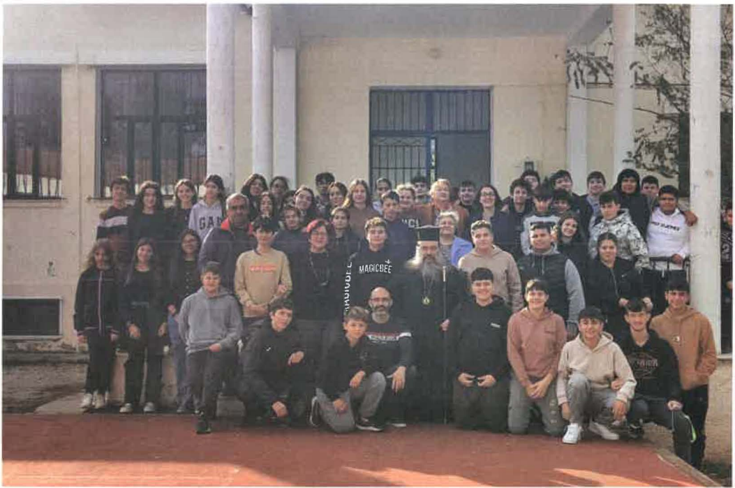
Διανομή Κ.Δ. και Όμηρου εις μαθητάς Γυμνασίου