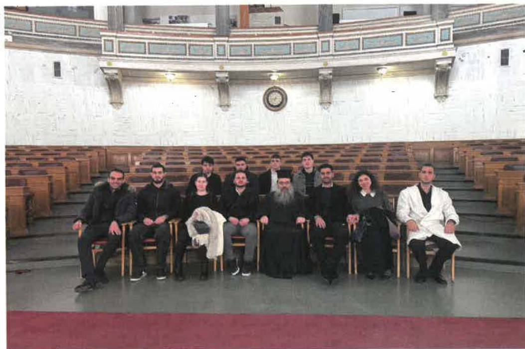
Εἰς τὴν Παλαιάν Βουλὴν