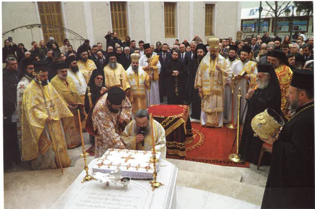
Προσευχόμενος διὰ τόν μέγαν ἀκρίταν (1974-2004) καί Μακεδονομάχον (2004-2023) ΙΕΡΑΡΧΗΝ (08.03.26)