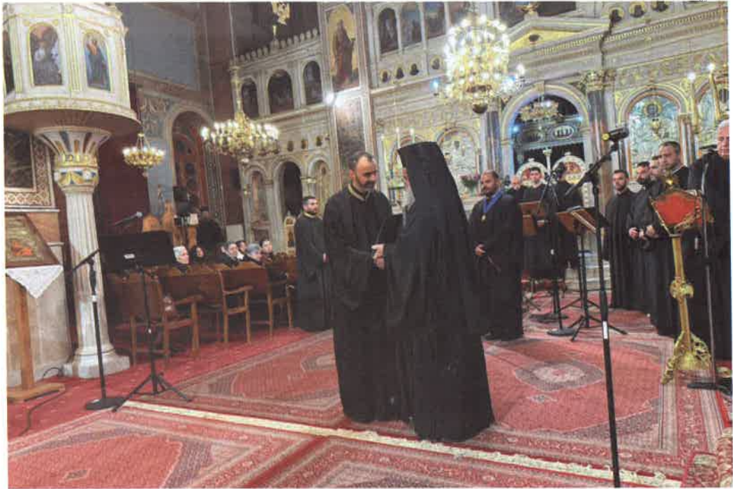
Συναυλία Ἐκκλ. Μουσικῆς καί τιμὴ πρὸς τὸν Μουσικολογ. Ἀθανάσιον Ξενούδη (21.03.26)