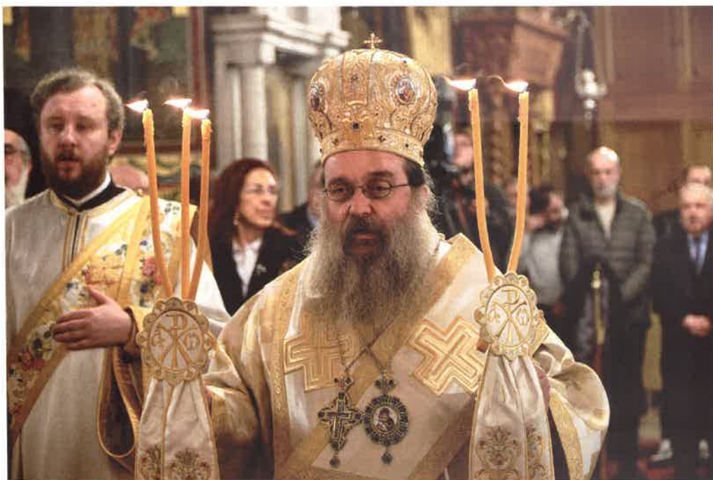
Ὁ Σεβ. Χίου κ. Μᾶρκος κατά τήν Θ. Λειτουργίαν εἰς Ἱ. Ν. Ἁγ. Γρηγορίου Παλαμᾶ Θεσσαλονίκης φέρων σταυρόν καί ἐγκόλπιον δωρηθέντα ὑπό τοῦ Θεσσαλονίκης ΑΝΘΙΜΟΥ (08.03.26)