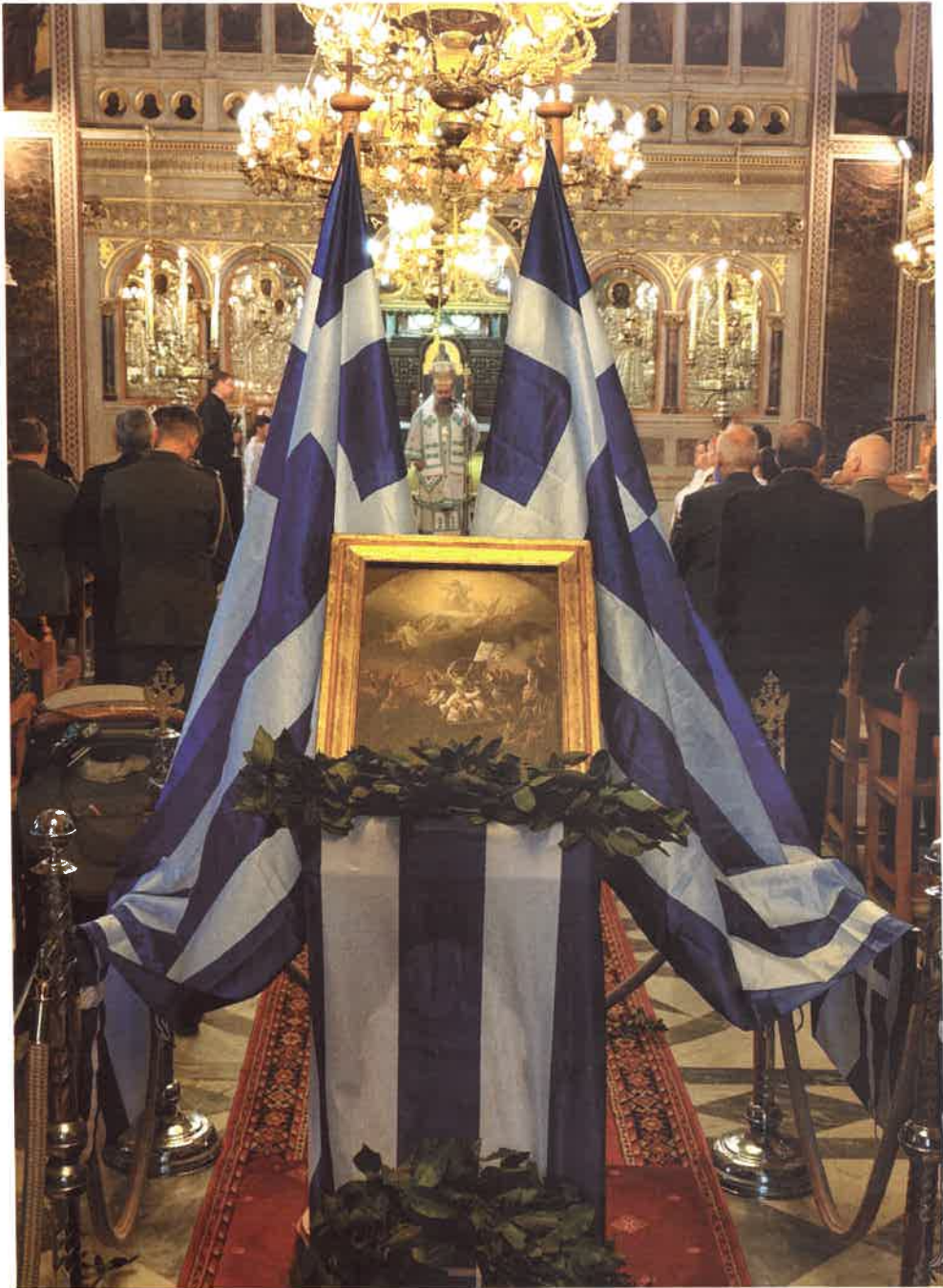
200ή Έπείτειος Έξόδου του Μεσολογγίου εις Ί. Μητροπ. Ναόν Χίου (Κυριακή Βαΐων 2026)