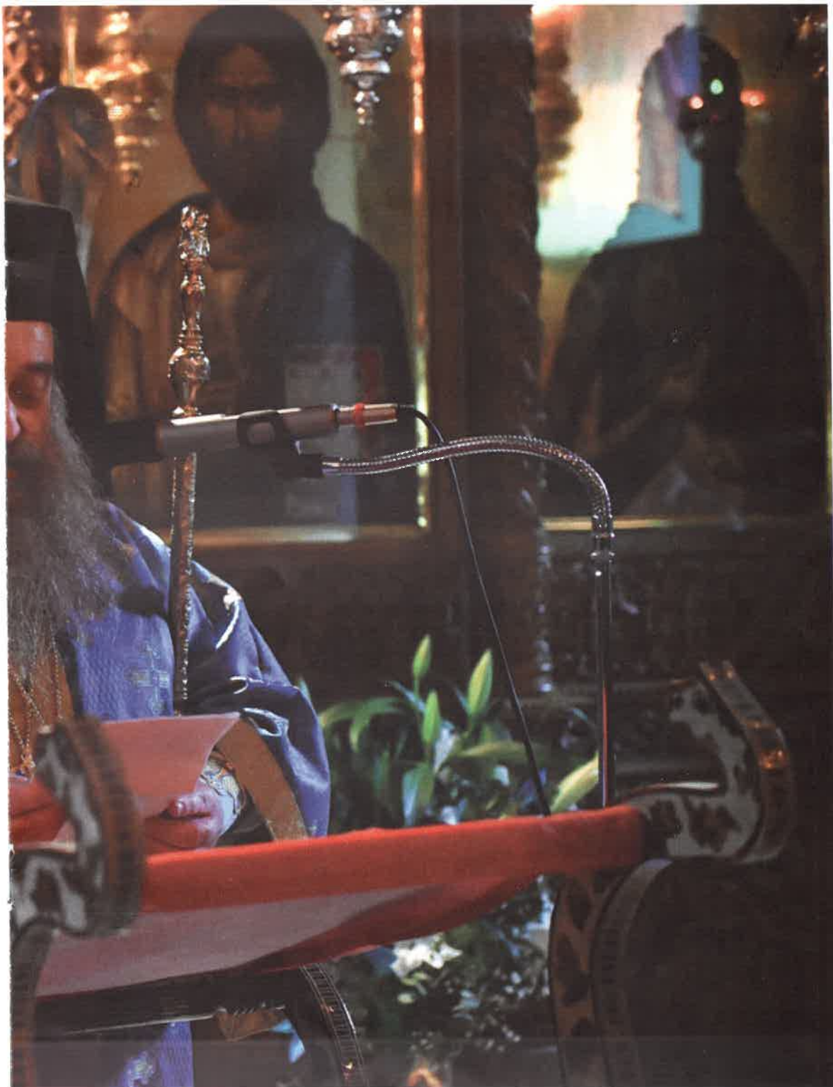
γιας Λαύρας τ' ὄρθρινό» μιλῶν εἰς Ἱ. Μ. Ἁγ. Λαύρας (Ἰουλίου 2026)