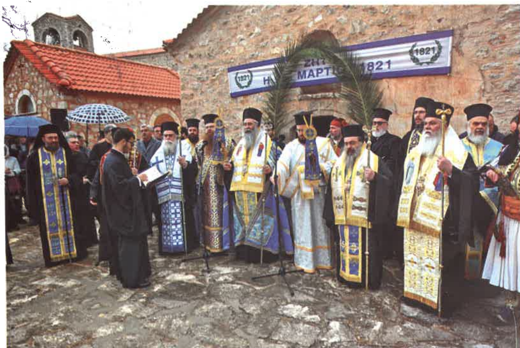
Δοξολογία εις Ἱ. Μ. Ἁγ. Λαύρας (25.03.26)