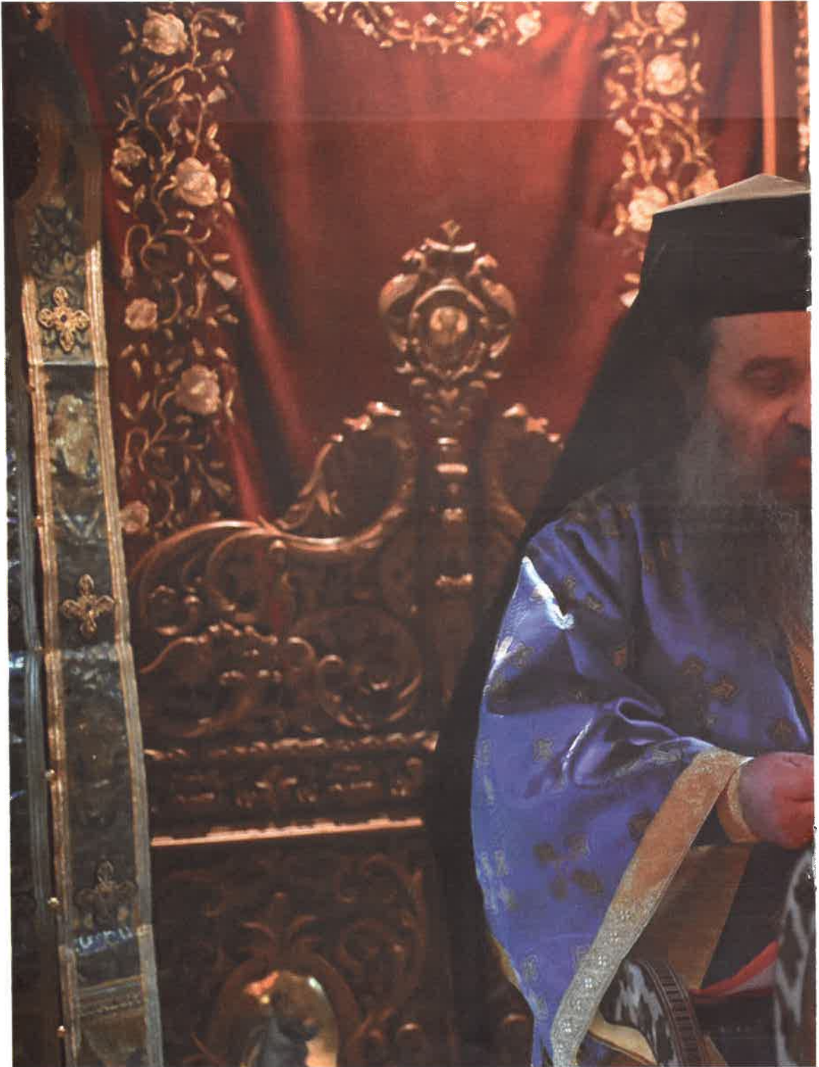
«Κι' ἀπ' τὸ γλυκὸ τῆς Ἄ 'Ο Σεβ. Χίου κ. Μάρκος ὁ (25ῆ Μαε