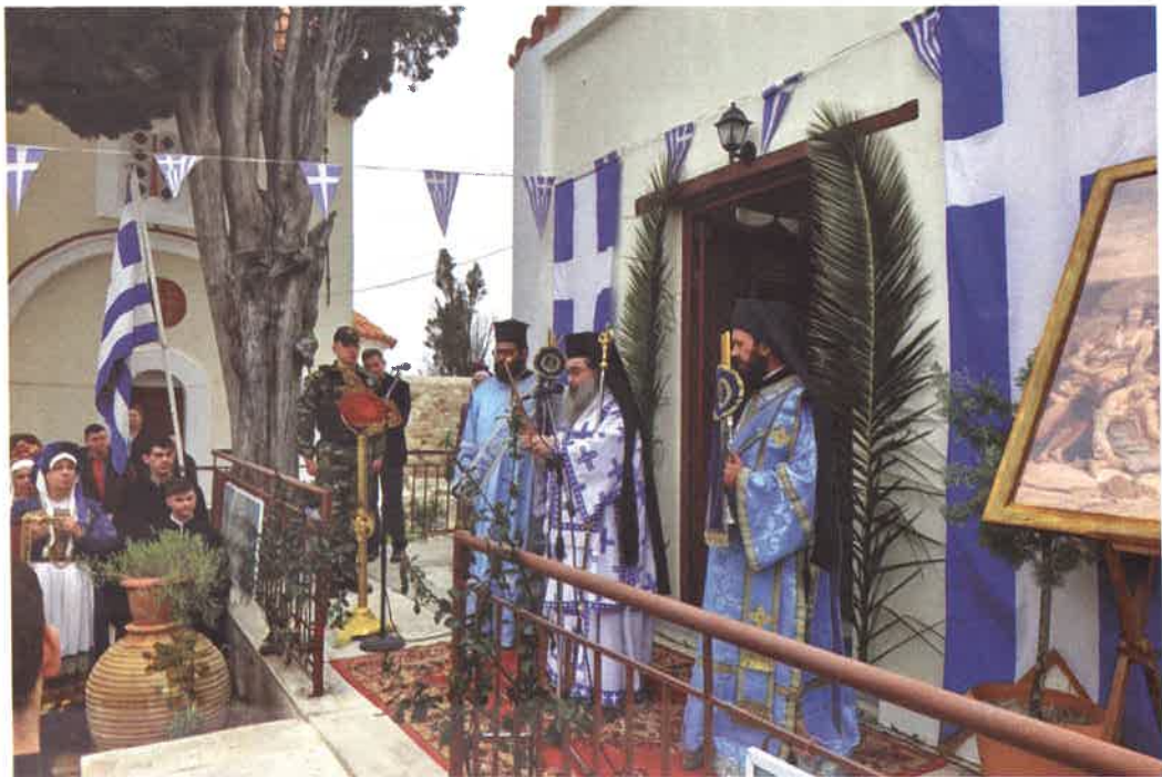
Ἐπέτειος Σφαγῆς τῆς Χίου εἰς Ἱ. Μ. Ἀγ. Μηνᾶ (14.04.26)