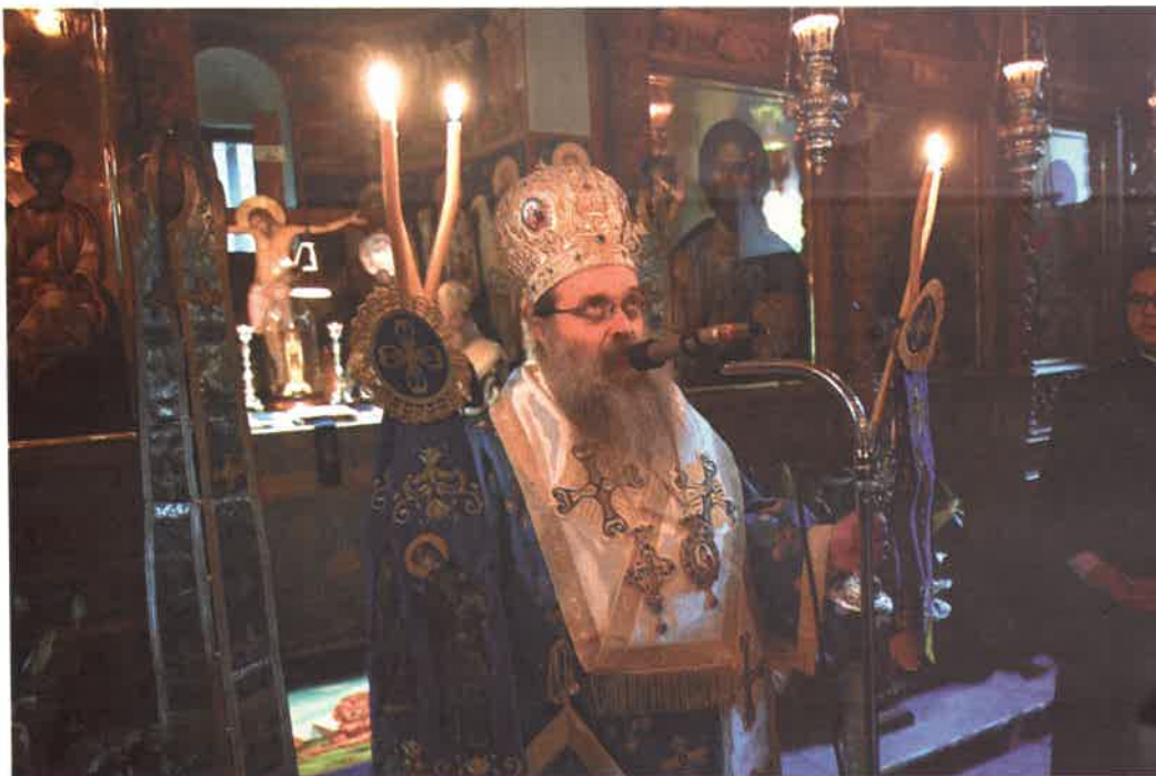
Θ. Λειτουργία εις Ἱ. Μ. Ἁγ. Λαύρας (25.03.26)