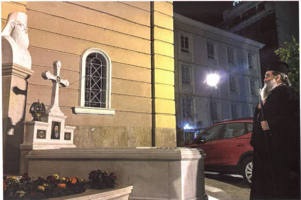
Ὁ Φιλόλογος Ἱεράρχης τοῦ Αἰγαίου πρὸ τοῦ μνημείου τοῦ Φιλολόγου ΙΕΡΑΡΧΟΥ τῆς Θράκης καί τῆς Μακεδονίας (08.03.26)