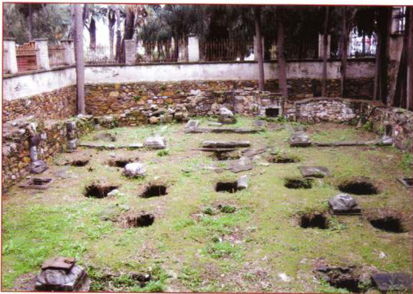
Ὁ ἐρειπωμένος Ἱ. Ναός Ἁγίου Βασιλείου, ἐντός τοῦ Δημοτικοῦ Κήπου τῆς πόλεως Χίου.