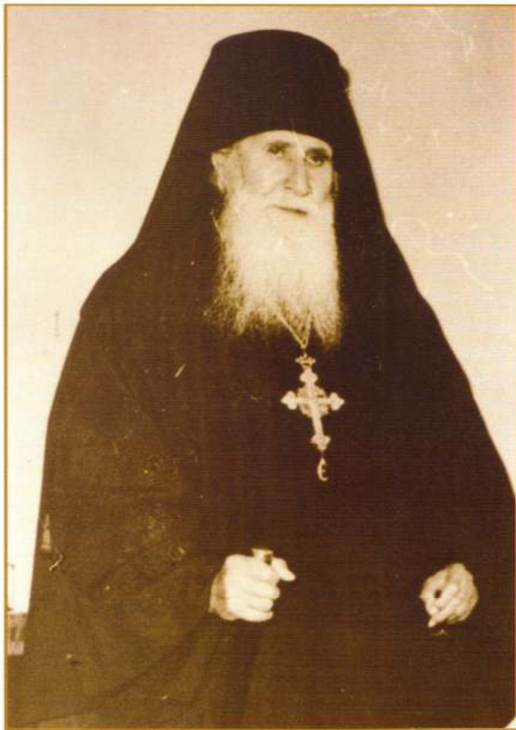
Φωτογραφία τοῦ Ὁσίου Πατρὸς ἡμῶν Ἀνθίμου τοῦ Χίου.

«Τοῦτο δέ καί εὐχόμεθα, τήν ὑμῶν κατάρτισιν» (Β' Κορινθ. ιγ', 9)