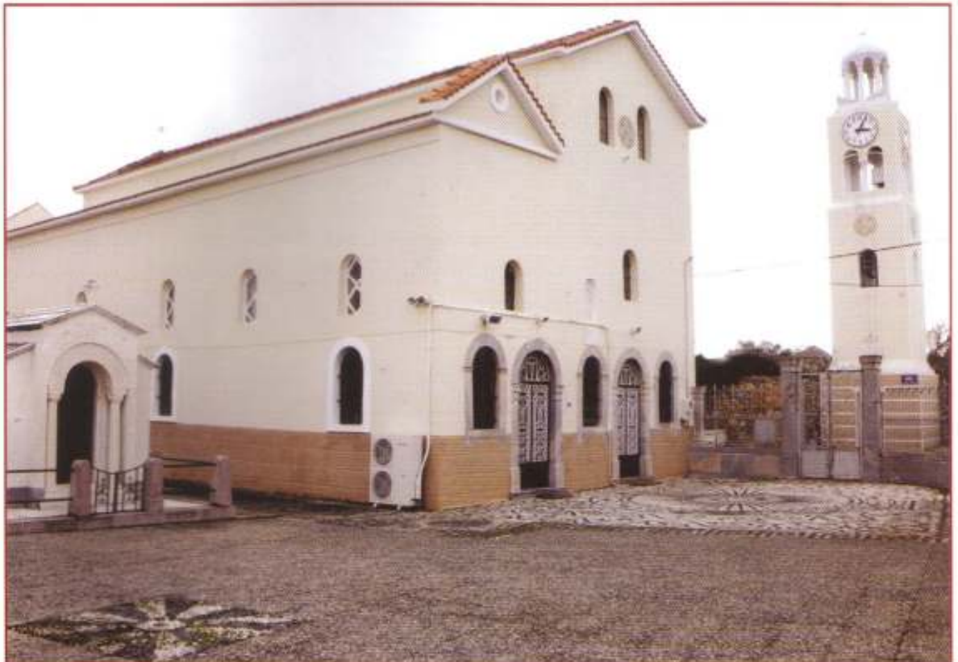
Ὁ Ἱερός Ναός Ἁγίου Πολυκάρπου Κάμπου.