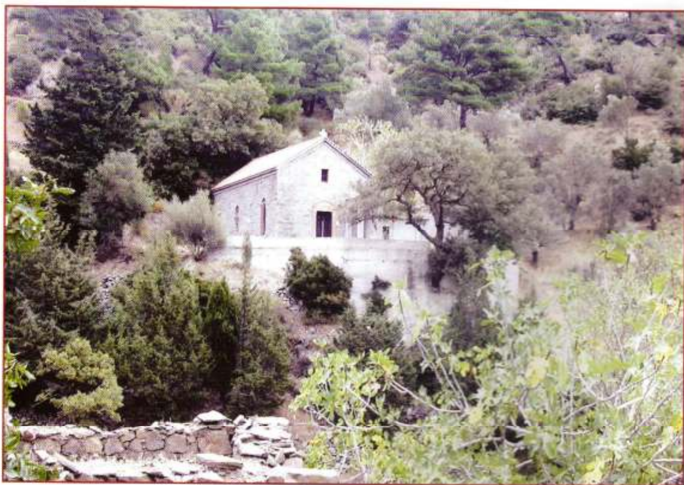
Ὁ Ἱερός Ναός Ἁγίου Ἀντωνίου παλαιᾶς Ποταμῆς Χίου.