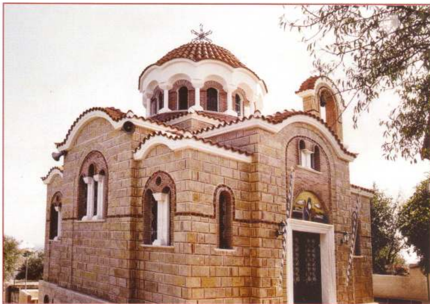
Ό Τερός Ναός Άγιου Άνθίμου του Χίου, εις Λειβάδια Χίου.

ΠΛΗΡΩΜΕΝΟ ΤΕΛΟΣ PORT PAYÉ Ταχ. Γραφείο ΧΙΟΥ Αρ. Αδ. ΕΛΛΑΣ - HELLAS