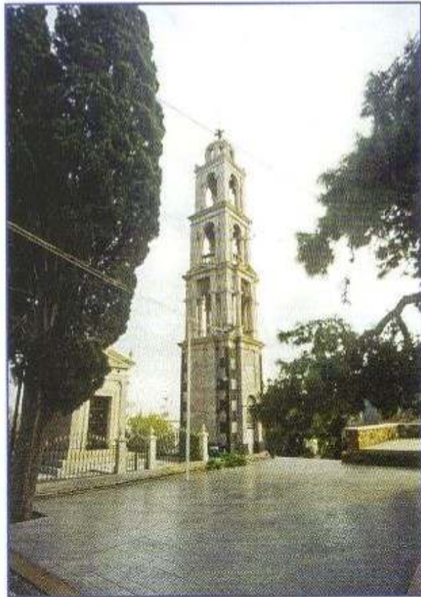
Τὸ κωδωνοστάσιο τοῦ Ἱεροῦ Ναοῦ Ἁγίου Λουκά Βαρβασίου, πόλεως Χίου.