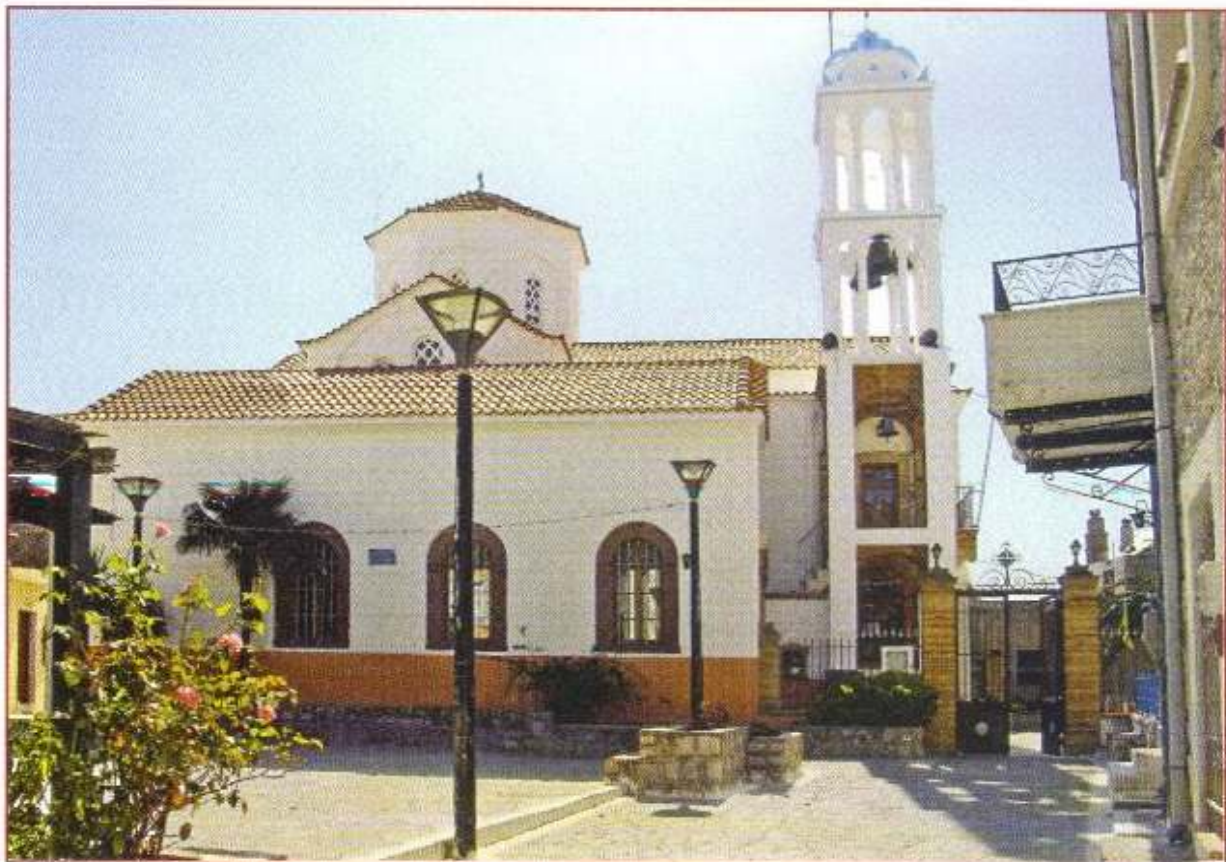
Ό Ίερός Ναός Άγίου Δημητρίου Άρμολίων.