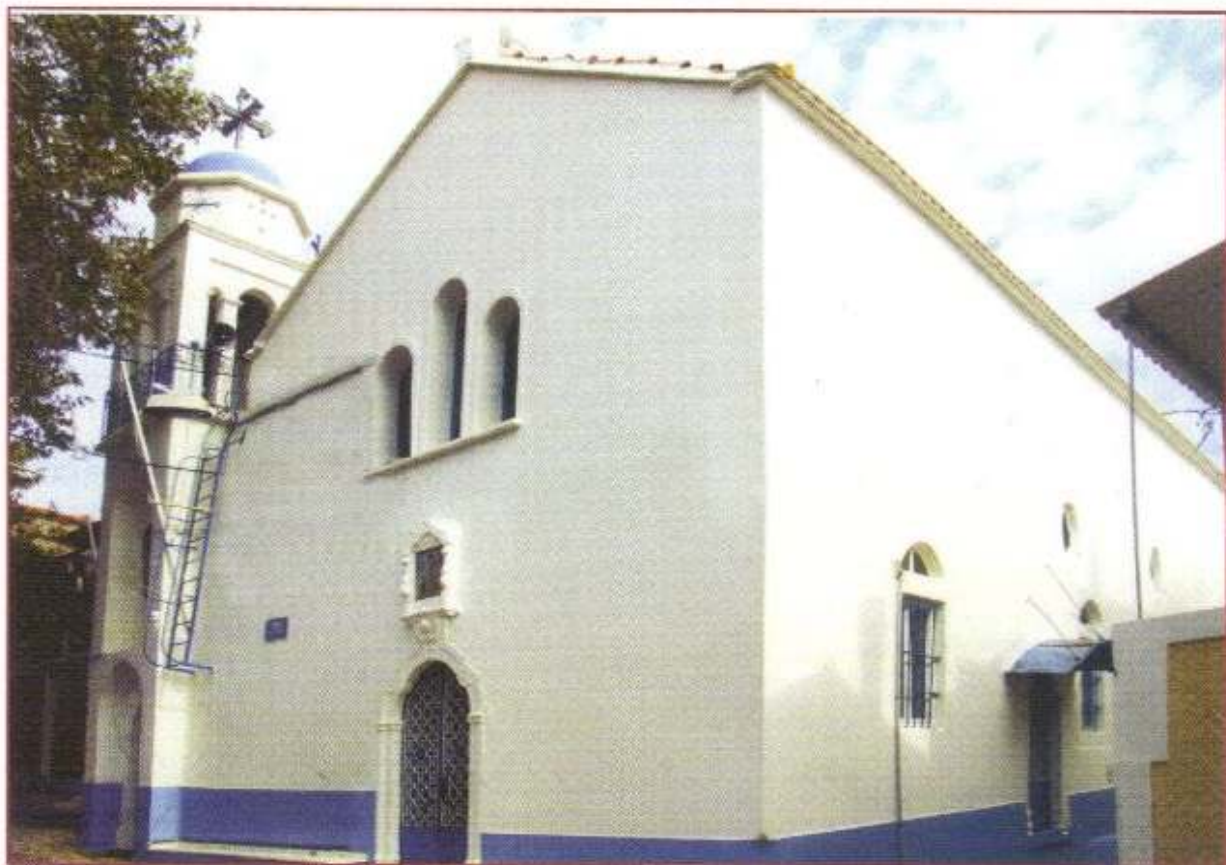
Ό Ίερός Ναός Άγίου Λουκά Άνω Καρδαμύλων.