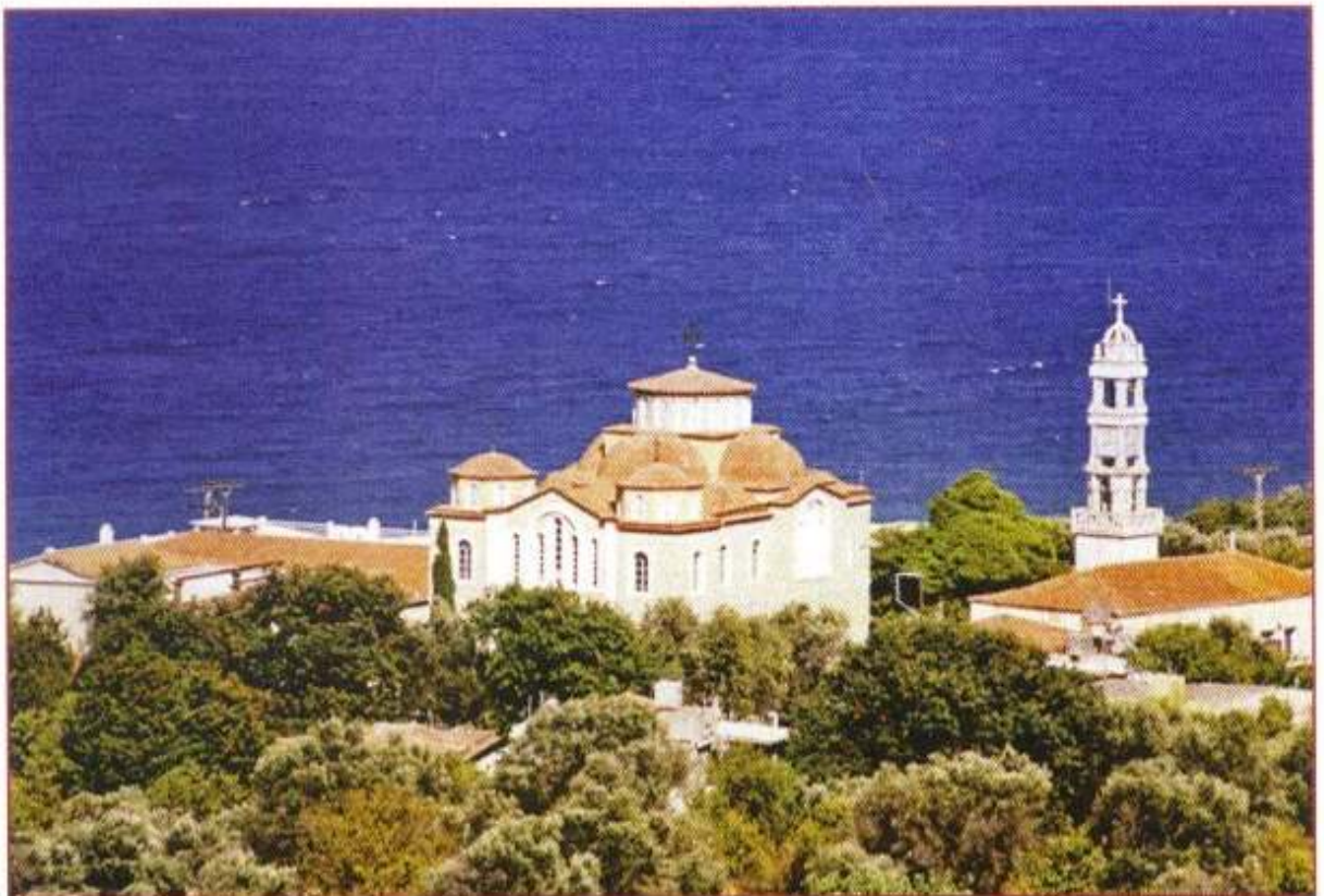
Ὁ Ἱερὸς Ναὸς Ἁγίου Λουκά Λειβαδίων, πόλεως Χίου.