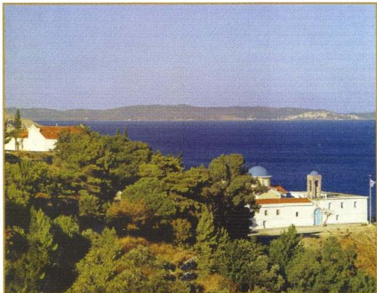
Ἡ Ἱερά Μονή Μυρσινιδίου.

«Τοῦτο δὲ καὶ εὐχόμεθα, τὴν ὑμῶν κατάρτισιν» (Β' Κορινθ. ιγ', 9)