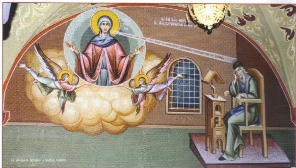
Τοιχογραφία τοῦ ἐν Χίῳ θαύματος τῆς Ἁγίας Παρασκευῆς εἰς τὸν Τερὸν Ναὸν Ἁγίας Παρασκευῆς Καρδαμύλων.