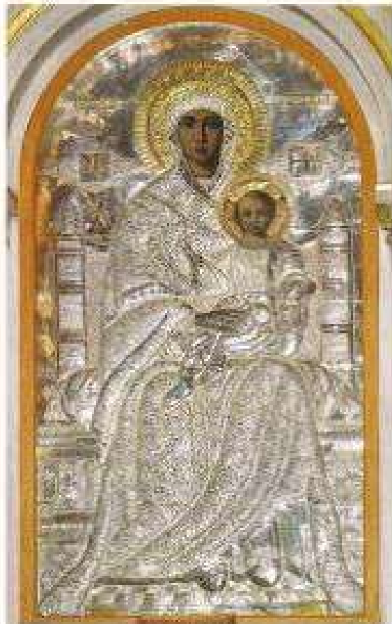
1. Εἰκὼν Παναγίας τέμπλου Ἱ. Μητροπολιτικοῦ Ναοῦ Χίου.