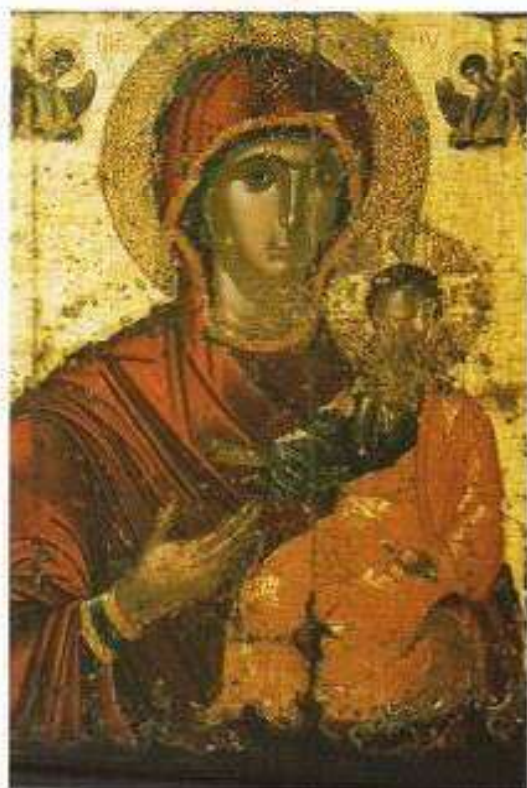
Ἰ. Εἰκὼν Παναγίας τῆς ἐπονομαζομένης τὰ Ἅγια τῶν Ἁγίων - "Ἡ Ὁδηγήτρια". τέμπλου Ἱ. Ναοῦ Κοιμ. Θεοτόκου Καλλιμασιᾶς.