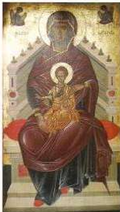
1. Εἰκὼν "Παναγία ἡ Καρδιοθαστάζουσα" τέμπλου Περῆς Νέας Μονῆς Χίου.