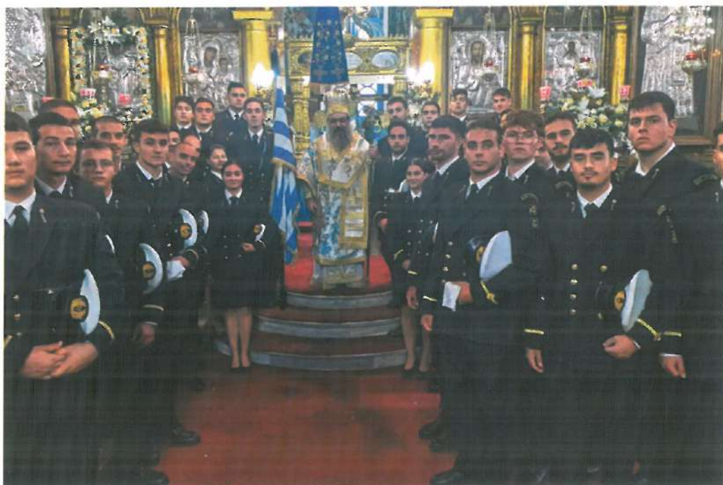
«Υπέρ τῶν ἐν θαλάσῃ πλεόντων» (Ο Σεβ. Χίου, Ψαρῶν καὶ Οἴνουσσῶν μὲ σπουδαστὰς τῆς ΑΕΝ Πλοιάρχων Οἴνουσσῶν. 06.12.23)