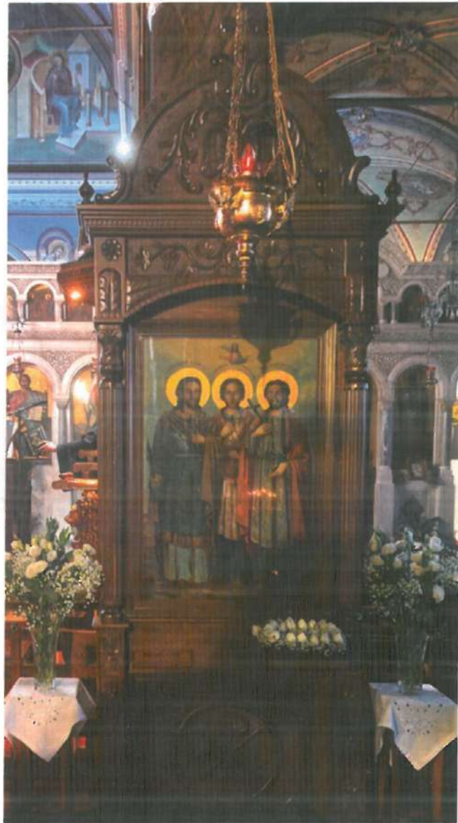
Προσκυνητάριον με εικόνα του Νεομάρτυρος Ἀγγελῆ του Ἀργείου καὶ ὕφασμα με τὸ αἷμα τοῦ Ἁγίου. (Γ. Ν. Ἀγ. Μάρκου Βροντάδου)