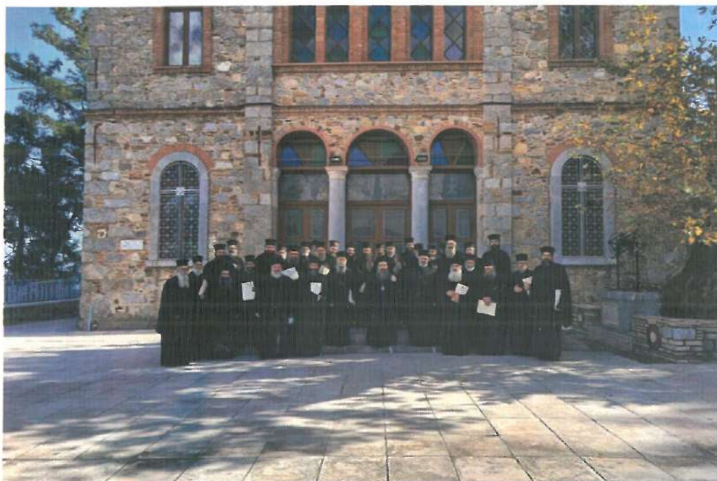
Β' Ιερατικόν Συνέδριον Ἱ. Μητρο. Χίου με θέμα: «Ἐνορία: Ὁ Χριστός ἐν τῷ μέσῳ ἡμῶν» (Κουκουναῤρειον Πνευμ. Κέντρον Ἱ. Ν. Λατομυτίσσης. 30.11.23)