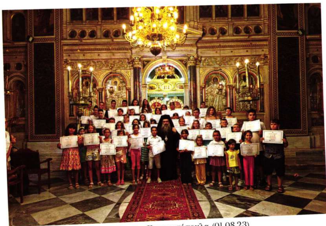
Ἀριστεύσαντα Κατηχητόπουλα (01.08.23)

«Αἰέν ἀριστεύειν» (γιά τά ἀριστεύσαντα παιδιά τῶν Κατηχητικῶν Σχολείων)