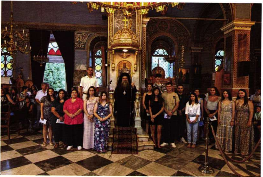
Υποτροφίες για φοιτητές από την Ί. Μητρ. Χίου (01.08.23)