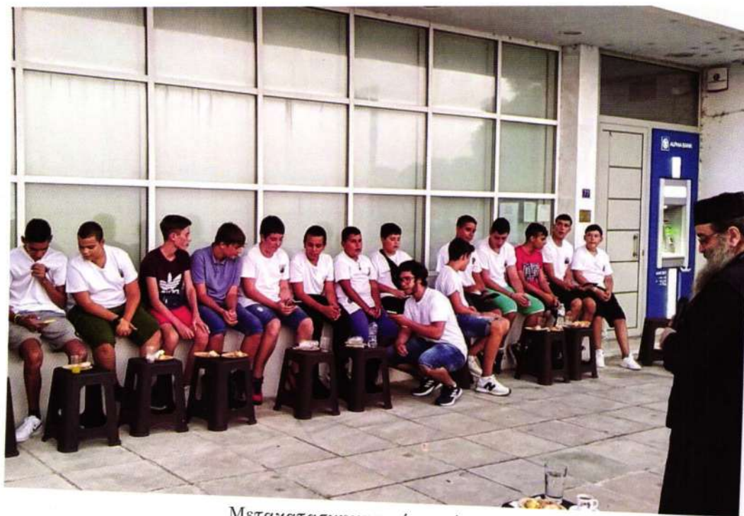
Μετακατασκηνοτική συνάντηση στην Βιβλιοθήκη ΑΓΙΟΣ ΑΓΑΠΗΤΟΣ (Αύγουστος 2023)