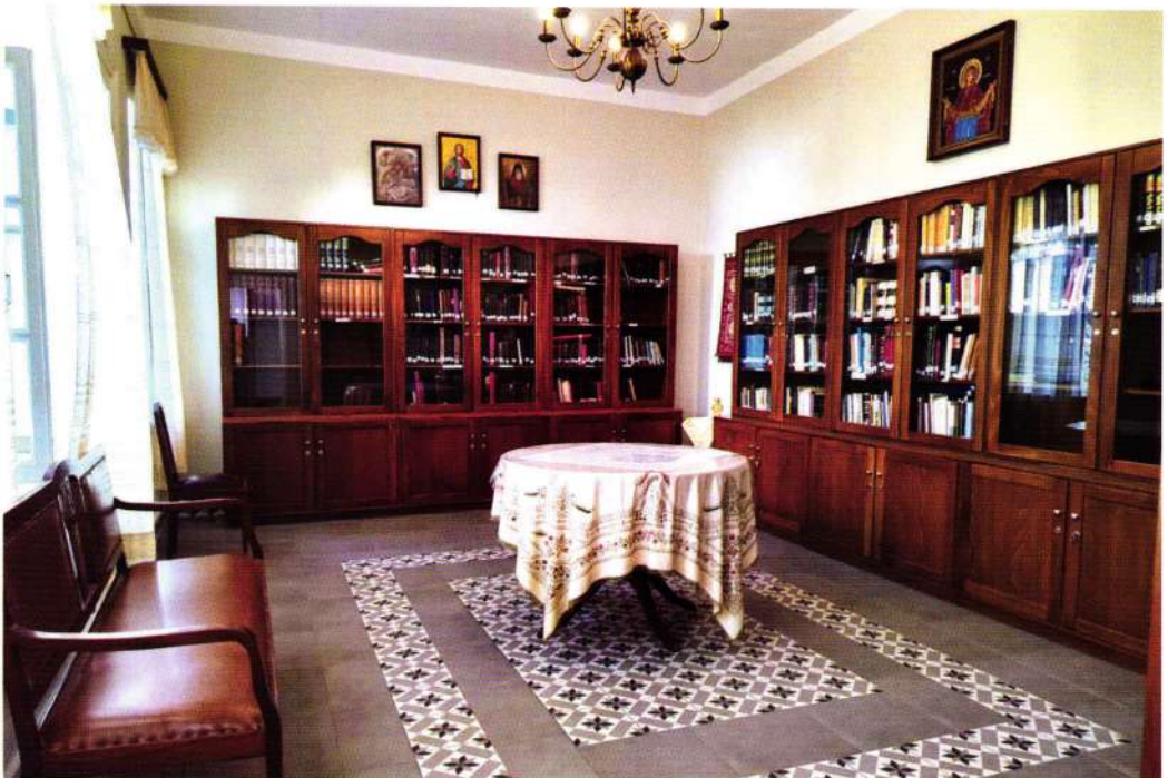
Βιβλιοθήκη Ί. Μονής Βοηθείας