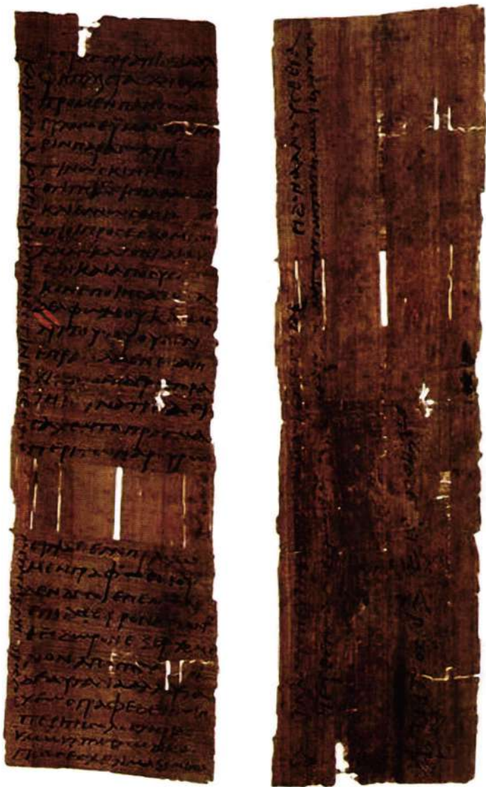
Πάπυρος 3ου ή 4ου αιώνας μ. Χ. (P.Oxy. XXXI 2601)