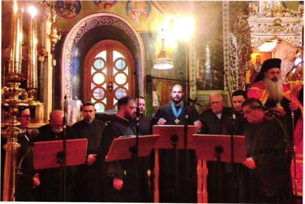
«Άδοντες και ψάλλοντες» (Ι. Πρ. Αγ. Μαρκέλλης - Ιούλιος 2023).