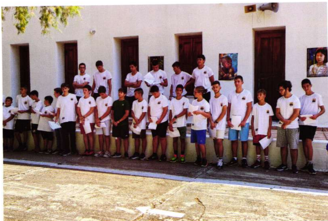
«ΤΟ ΚΑΡΑΒΙ ΤΟΥ ΧΡΙΣΤΟΥ» ΠΡΟΣ «ΠΑΝΤΑ ΤΑ ΕΘΝΗ» (Κατασκήνωση Ί. Μ. Χίου - Αύγουστος 2023)