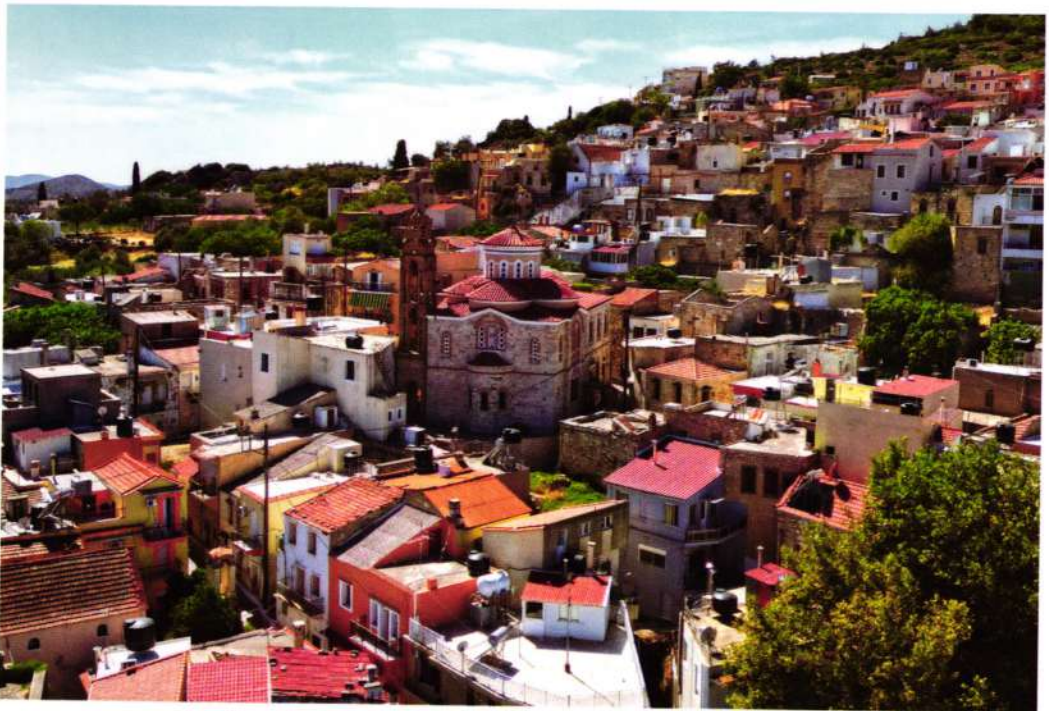
Τερός Ένοριακός Ναός Κοιμήσεως Θεοτόκου Θολοποταμίου