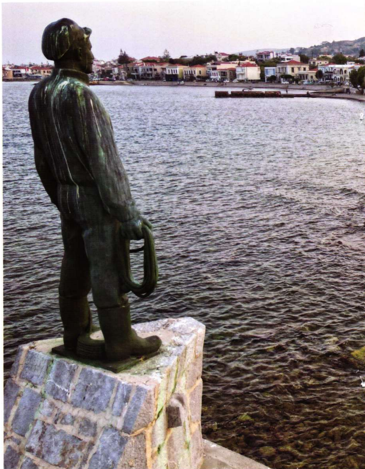
Πρό τοῦ Ἀφανοῦς Νο