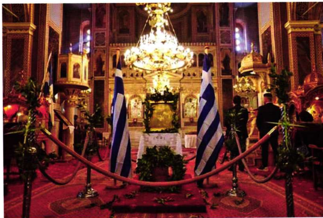
«Τό Μεσολόγγι... φωτεινό μετέωρο» (Κυριακή Βαΐων - Ἰ. Μητρ. Ναός Χίου)