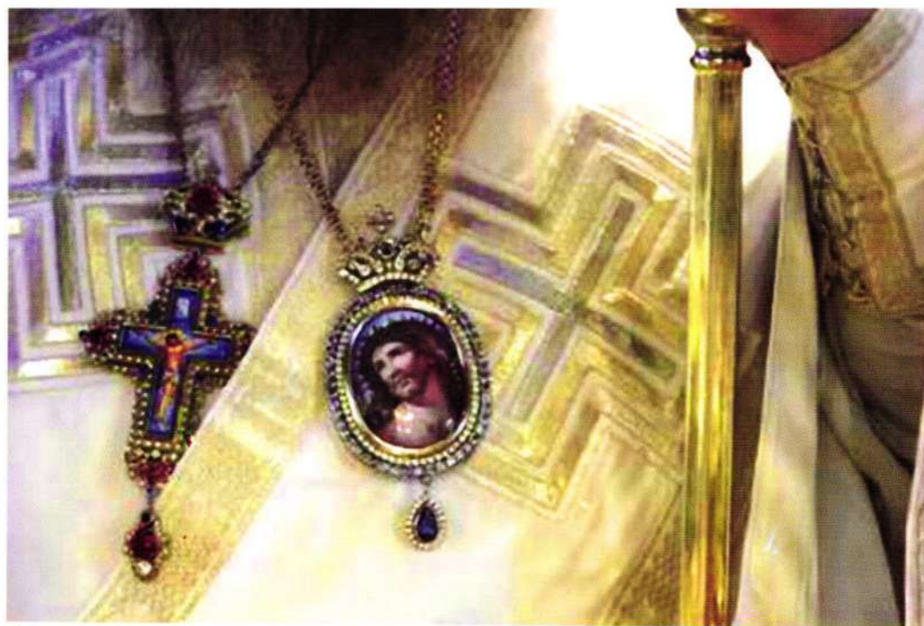
«Στέφανον ἐξ ἀκανθῶν περιτίθεται, ὁ τῶν ἀγγέλων Βασιλεύς»