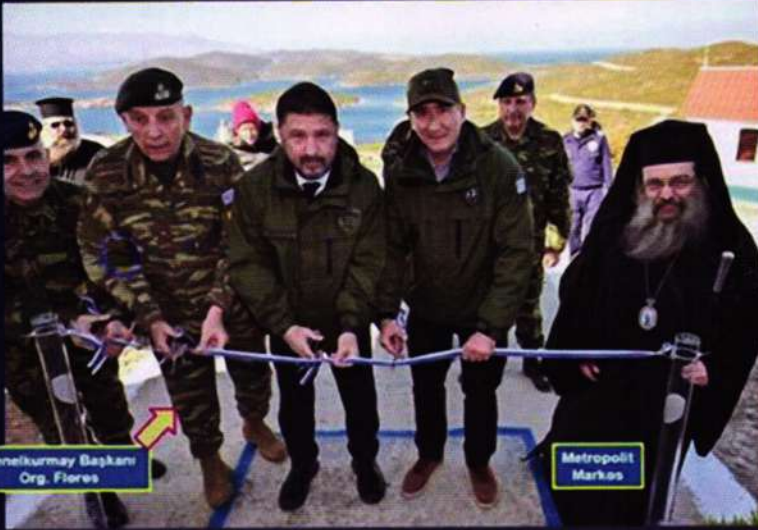
Genelkurmay Başkanı Org. Flores