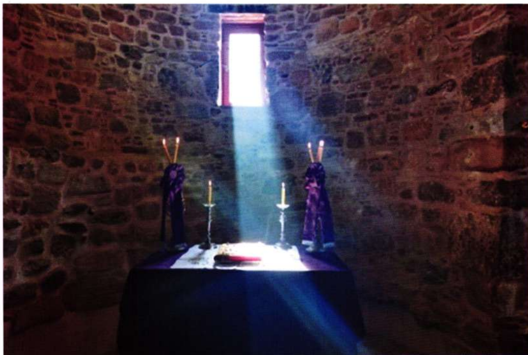
Στιγμές Κατακοιμῶν καί Βυζαντίου (Ι. Πρ. Παλαιοχριστιανικῆς Βασιλικῆς Ἁγ. Ἰσιδώρου)