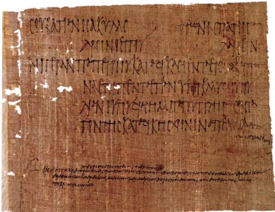
Φιλολογικόν Είλητάριον: Μαθήματα Παλαιογραφίας – Παπυρολογίας στη Βιβλιοθήκη ΑΓ. ΑΓΑΠΗΤΟΣ