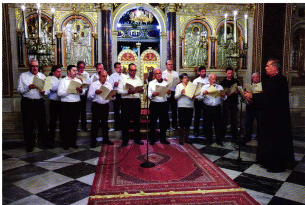
Ἡ Χορωδία Σπουδαστῶν τῆς Σχολῆς Βυζαντινῆς Μουσικῆς Ἱ. Μ. Χίου (15.04.22).