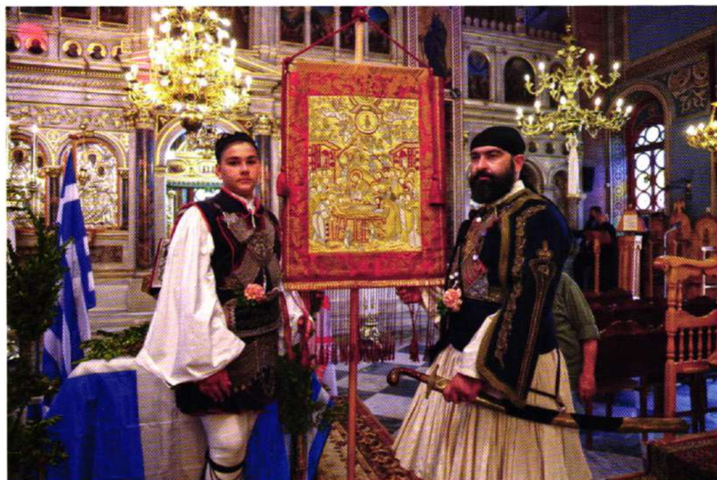
ΤΟ ΛΑΒΑΡΟ ΤΗΣ ΑΓΙΑΣ ΛΑΥΡΑΣ (Γ. Μητρ. Ναός Χίου 25.04.22).