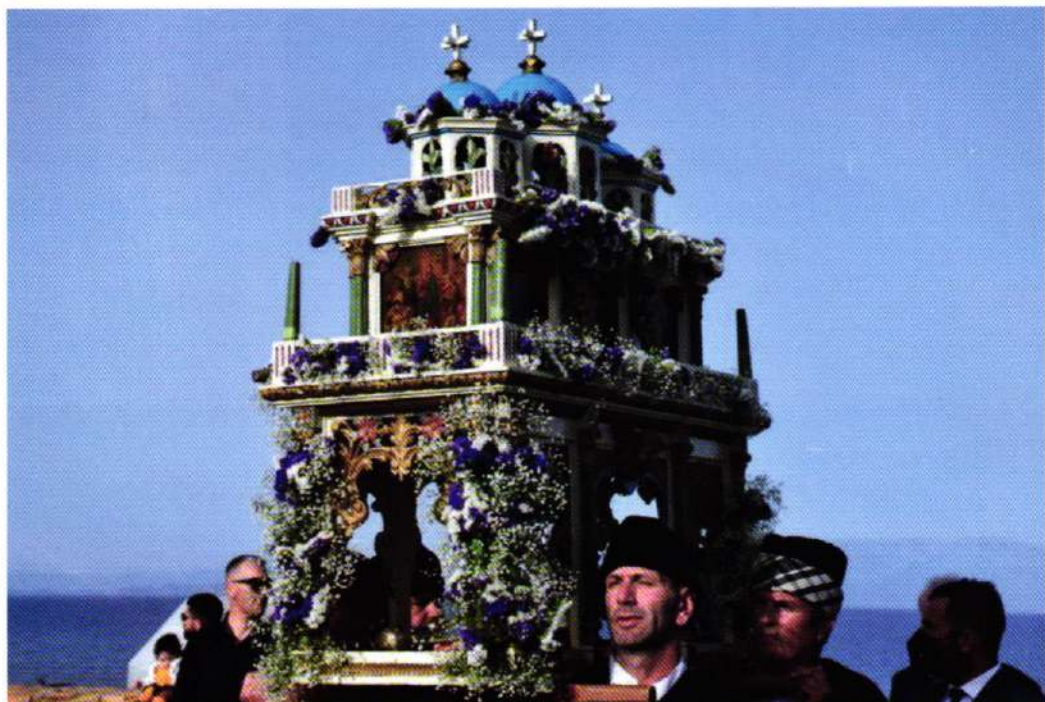
«Πάλι με χρόνους με καιρούς πάλι δικά μας θά 'ναι» Ἐπιτάφιος Ἁγ. Παρασκευῆς Καστέλου (22.04.22).