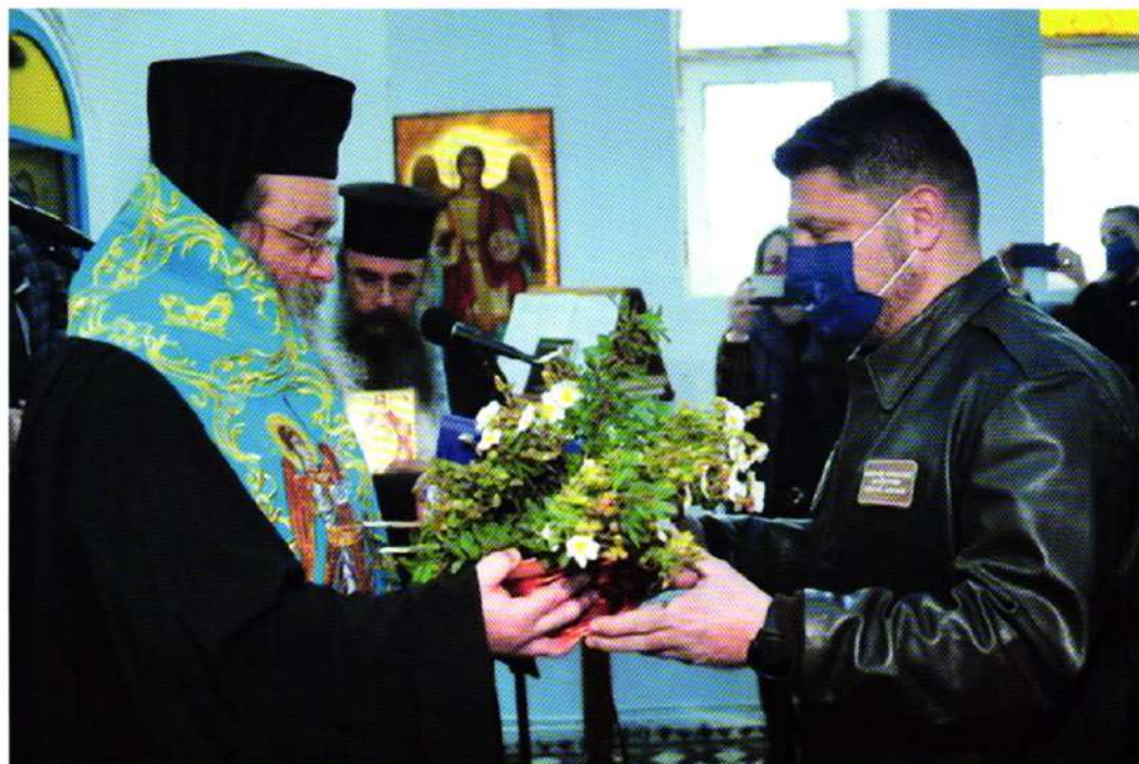
ΝΗΣΟΣ ΠΑΝΑΓΙΑ: ΕΛΩ ΕΙΝΑΙ ΕΛΛΑΣ (20.04.22).