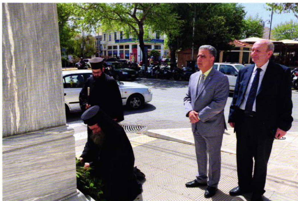
200 χρόνια από τό μαρτύριο του Ίερομάρτυρος Πλάτωνος Χίου (23.04.22).