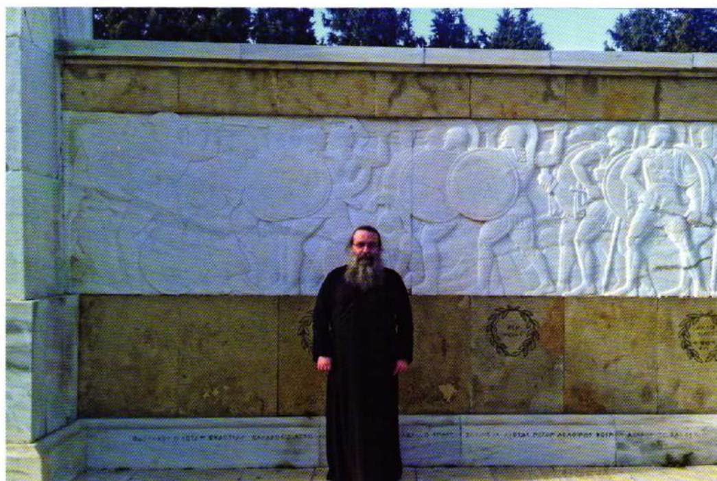
«Τοῖς κείνων ῥήμασι πειθόμενοι» (Θερμοπύλες, 10.04.22).