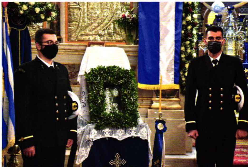
Ἡ Ἱερά Εἰκών τῆς Θεοτόκου (Βραχονησίδα Παναγιά). Σκεπάζει τὴν Στεριά καὶ τὴν Θάλασσά μας.