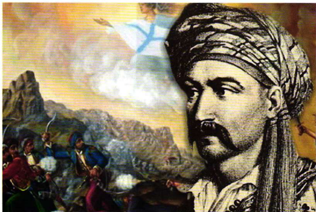
Νιζηταράς ὁ Τουρκοφάγος.