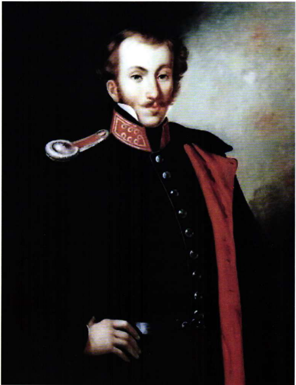
Πρίγκιψ Δημήτριος Ύψηλάντης

ΠΑΡΕΧΟΜΕΝΟ ΤΡΑΦΕΙ POST-PAYE Τεκ. Επιταγής ΕΚΦ Αρ. Α6 ΕΛΛΑΣ - ΘΕΣΣΑΛΙΑ