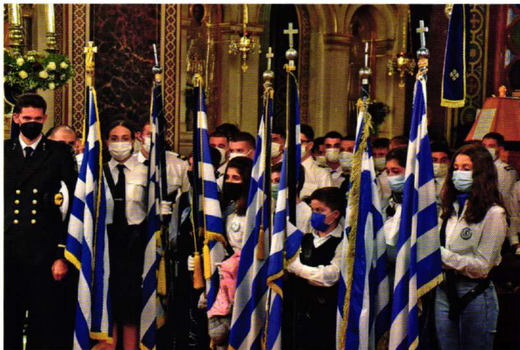
Τὰ Ἑλληνόπουλα τῆς Χίου μέ τίς σημαῖες μας.