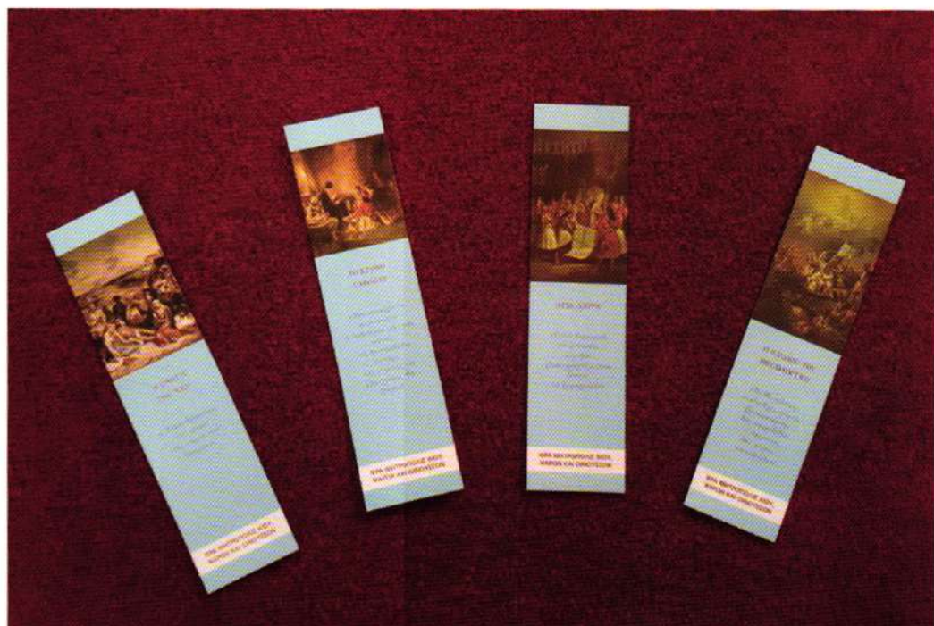
Έπετειακοί σελιδοδείκται Γ. Μ. Χίου (Ιστορικά Γεγονότα)