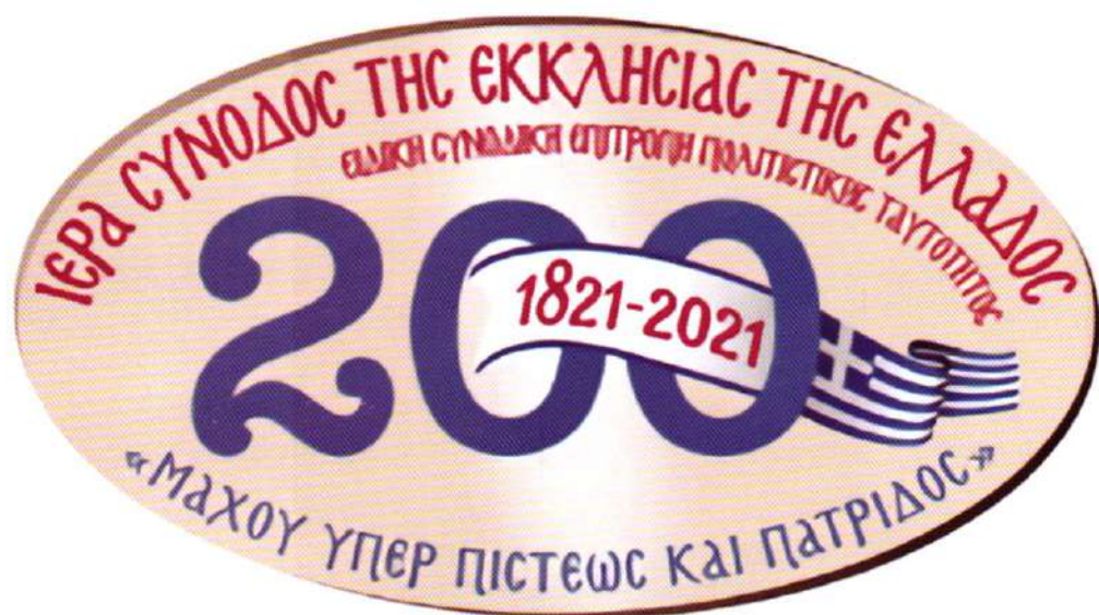
Τό σῆμα τῶν ἐκδηλώσεων τῆς Ἱερᾶς Συνόδου διὰ τὰ 200 ἔτη ἀπό τό 1821.