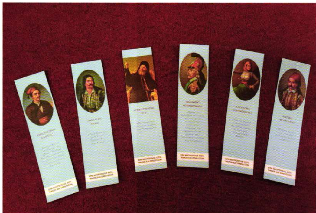
Έπετειακοί σελιδοδείκται Γ. Μ. Χίου (Μορφαί Ήρώων)