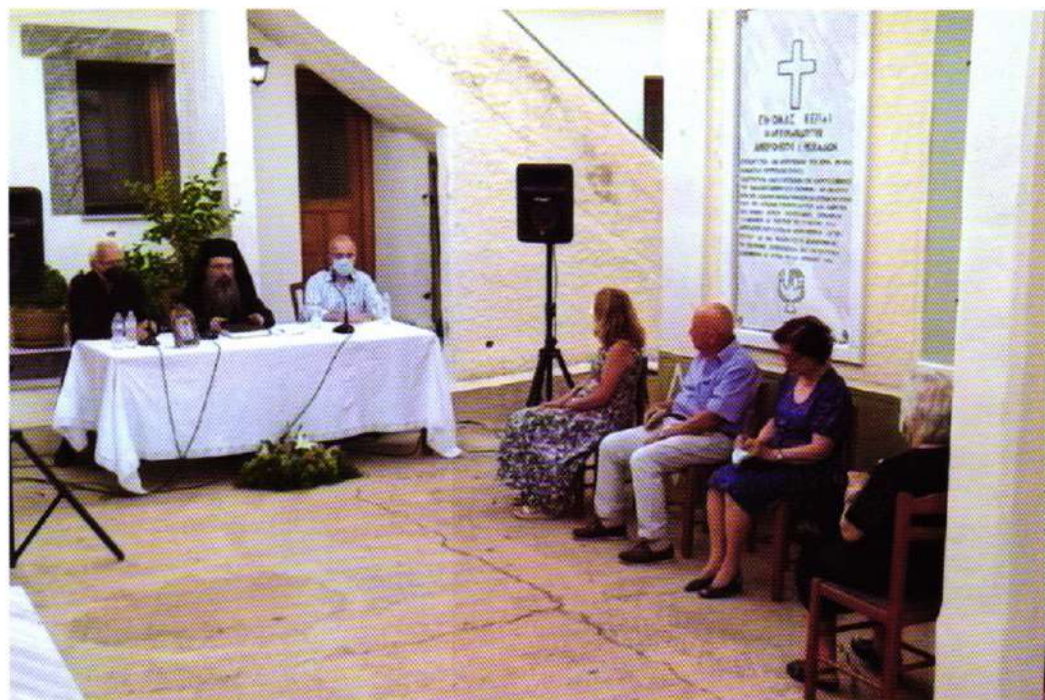
Παρουσίαση «ΝΕΟΥ ΧΙΑΚΟΥ ΛΕΙΜΩΝΑΡΙΟΥ» (Γ. Μ. Μυρσινιδίου 08.08.21)