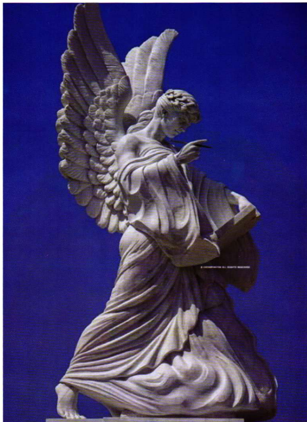
Η ΛΟΞΑ ΤΩΝ ΨΑΡΩΝ

ΕΛΛΗΝΙΚΟ ΤΕΛΟΣ POST PAID Την Κυριακή 10/7 Αρ. Αθ. ΕΛΛΑΣ - ΕΛΛΑΣ