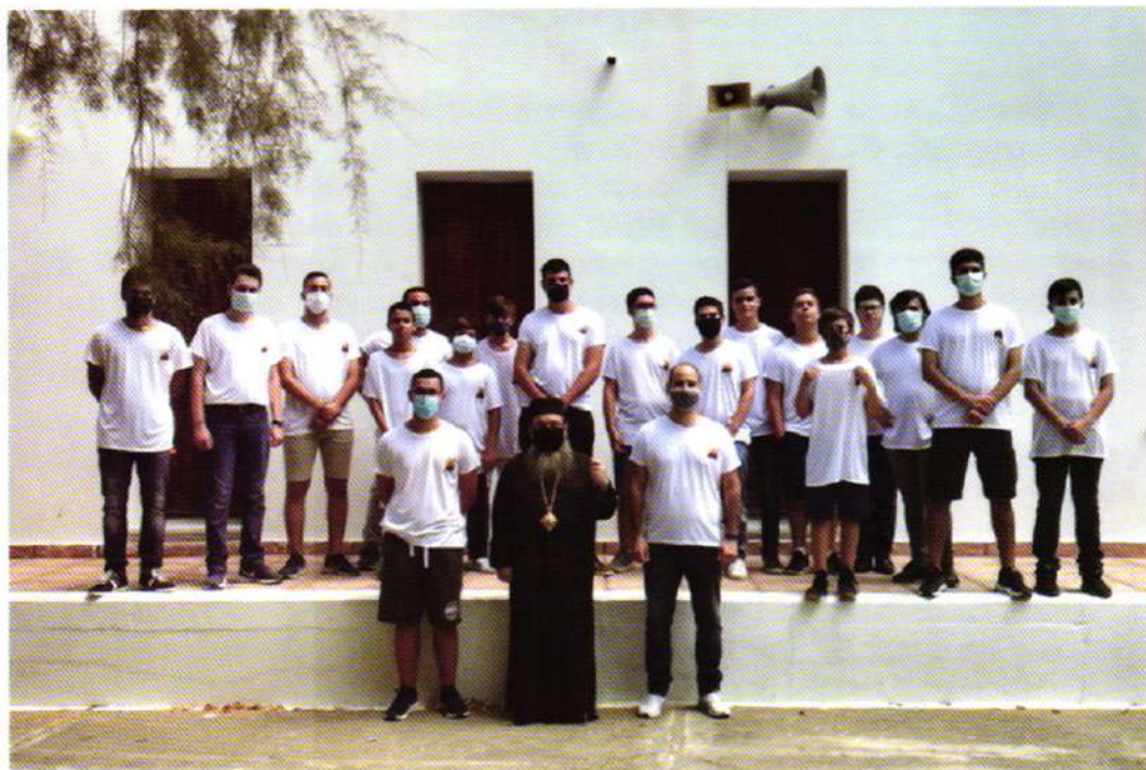
«Ἀπ' τό γλυκό τῆς Ἁγίας Λαύρας τ' ὄρθρινό». Κατασκήνωσις «ΤΟ ΚΑΡΑΒΙ ΤΟΥ ΧΡΙΣΤΟΥ» (22.08.21)