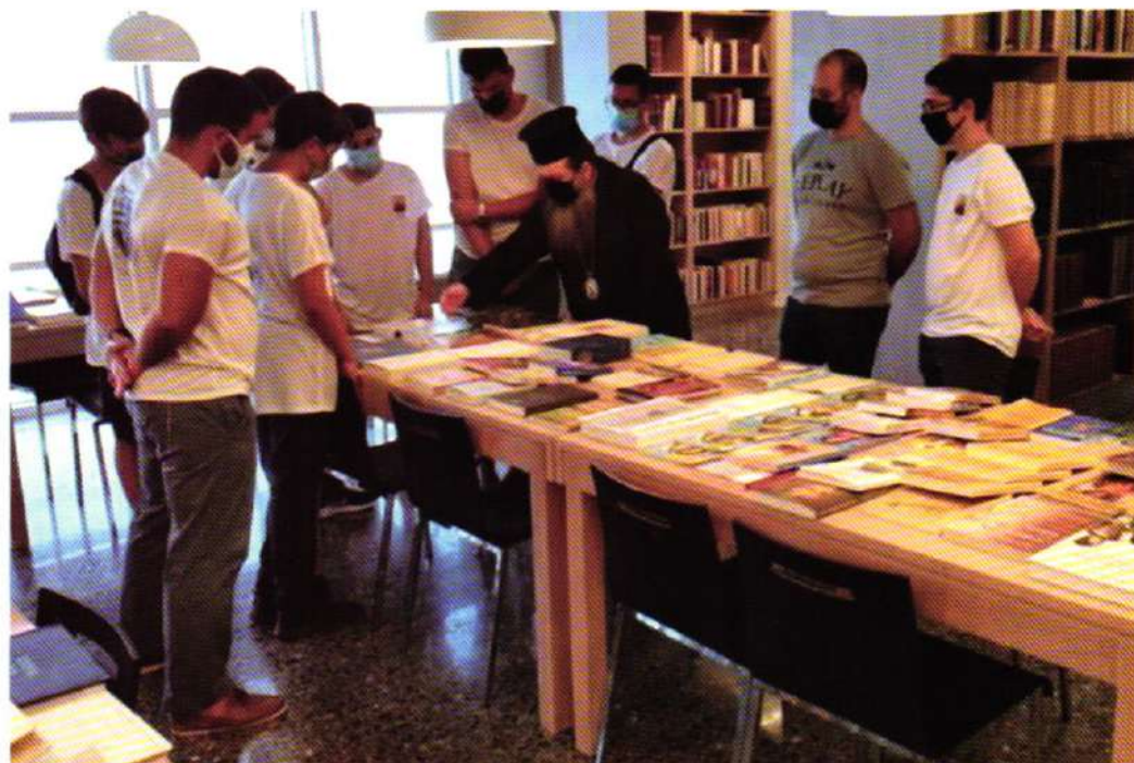
Ἐπίσκεψις τῆς κατασκηνώσεως «ΤΟ ΚΑΡΑΒΙ ΤΟΥ ΧΡΙΣΤΟΥ» εἰς ἔκθεσιν βιβλίου διά τό 1821 (Βιβλιοθήκη ΑΓ. ΑΓΑΠΗΤΟΣ 31.08.21)