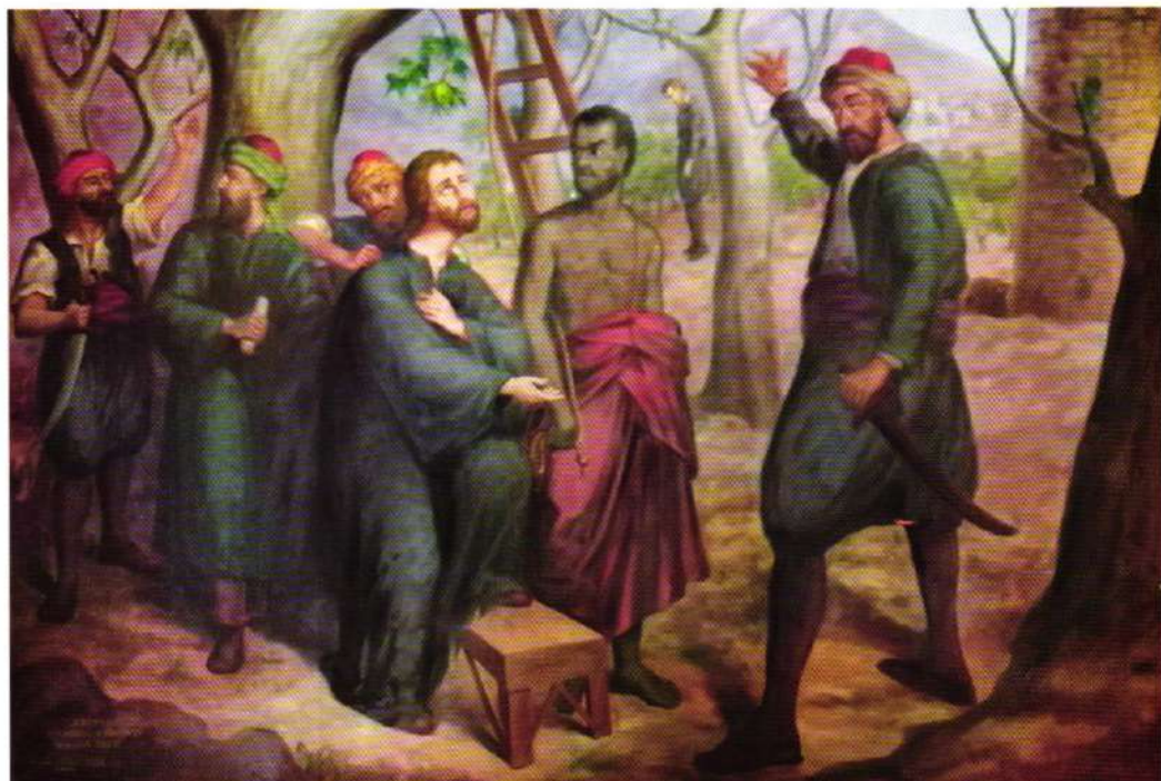
Απαγχονισμός Τερομάρτυρος Αρχidiaκόνου Μακαρίου (τοῦ Γαρρηῆ)