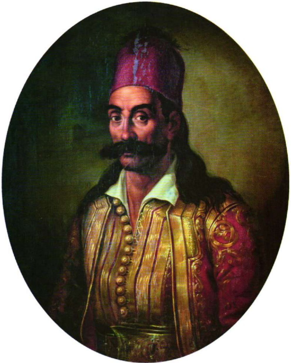
ΓΕΩΡΓΙΟΣ ΚΑΡΑΪΣΚΑΚΗΣ Ὁ σταυραετός τῆς Ρούμελης

ΠΑΡΩΡΘΕΝΟ ΤΕΛΟΣ POST PAID Τὸν ἱστορικοῦ ΝΕΟΥ Αἰ. ΑΣ SCOTT WELLS