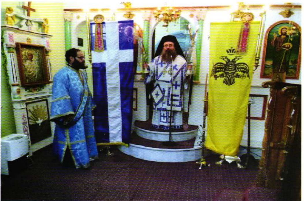
Μνήμη Νεομάρτυρος Άγ. Άνδρέου του Άργέντη. (Ι.Ν. Άγ. Άνδρέου Χίου 29.5.2021).