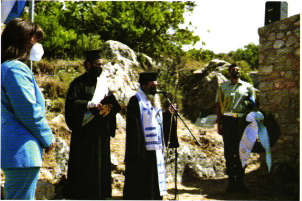
Έπιμνημόσυνος Δέησις διά τούς ήρωας τής σφαγής τής Χίου, παρουσία τής Έξοχ. Προέδρου τής Δημοκρατίας κ. Λίκατερίνης Σακελλαροπούλου εις Ανάβατον Χίου. (16.5.2021)