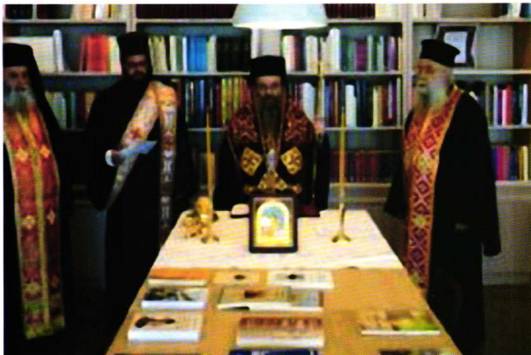
Άγιασμός εκδόσεως βιβλίων διά τό 1821 εις τήν Βιβλιοθήκην «ΑΓ. ΑΓΑΠΗΤΟΣ»