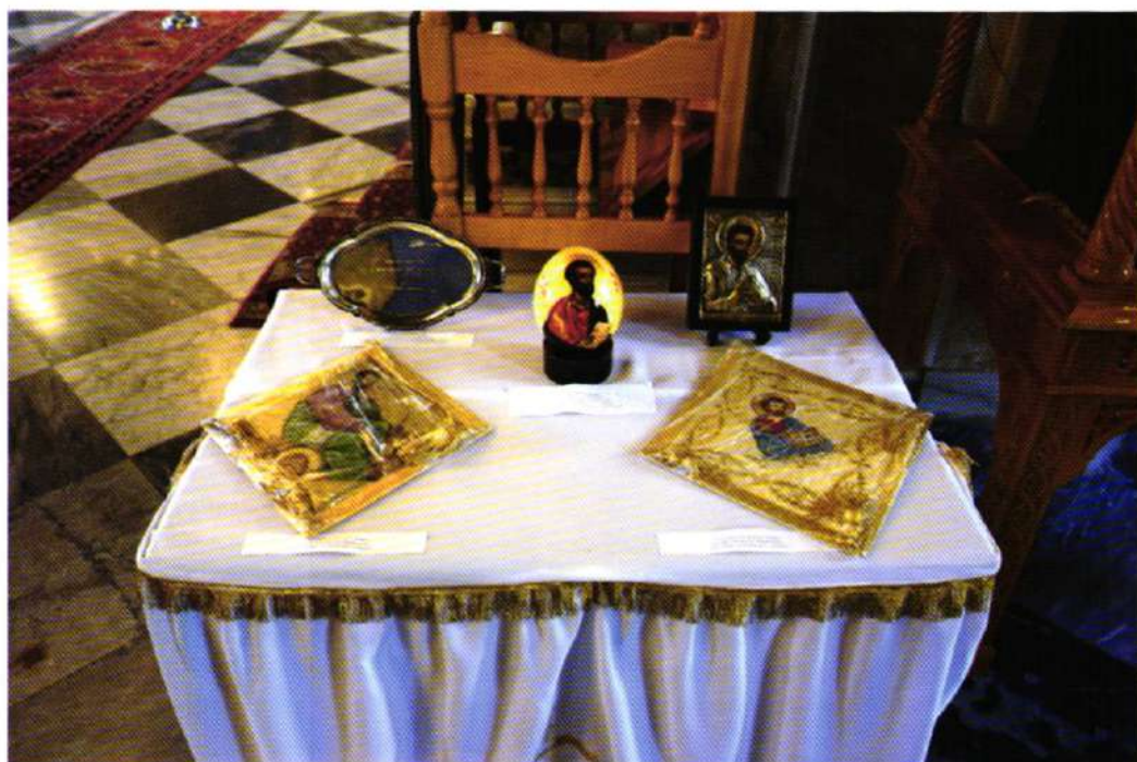
Έκθεσις Ἱ. Εἰκόνων καί κειμηλίων ἀφορώντων εἰς τόν Ἀπόστολον καί Εὐαγγελιστήν Μάρκον εἰς τόν Ἱ. Μητροπολιτικόν Ναόν Χίου.