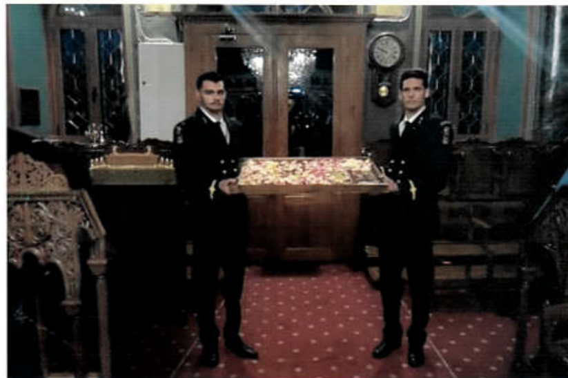
Σπουδασταί τῆς ΑΕΝ Πλοιάρχων Οἰνουσσῶν ἄτανεῦον τόν Ἐπιτάφιον.