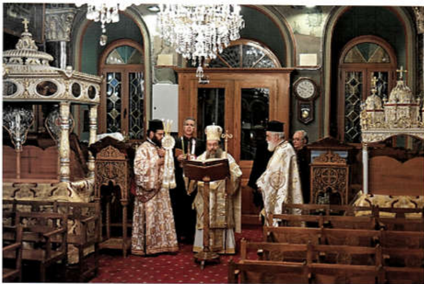
«Ἠγέρθη, οὐκ ἔστιν ὥδτε» (Μάρκ. 1στ'. 6).