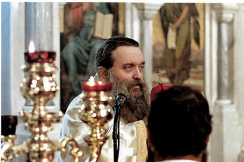
«Σώμα Χριστοῦ μεταλάβετε, πηγῆς ἀθανάτου γέυσαθε» (Κοινωνιὸν τοῦ Πάσχα).