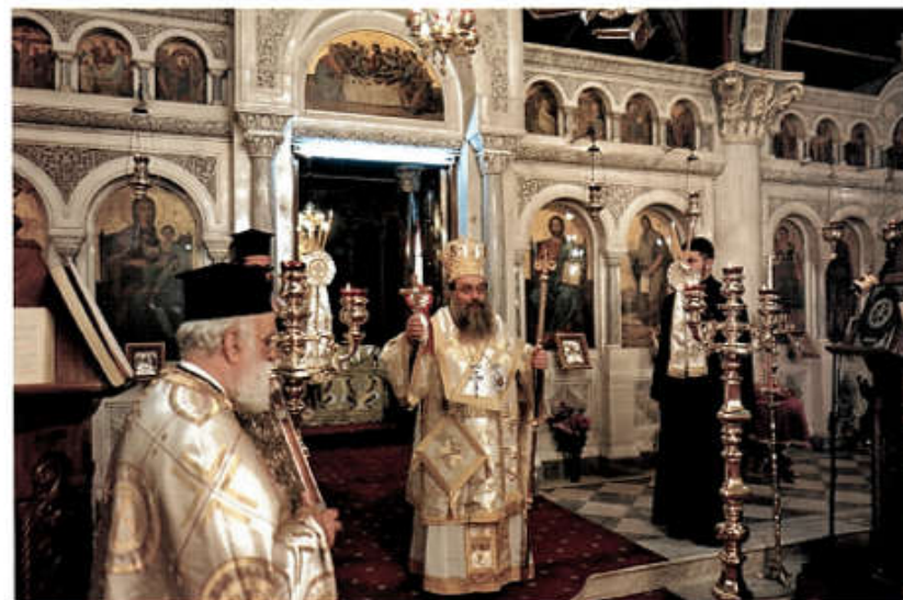
«Δεῦτε λάβετε Φῶς...»